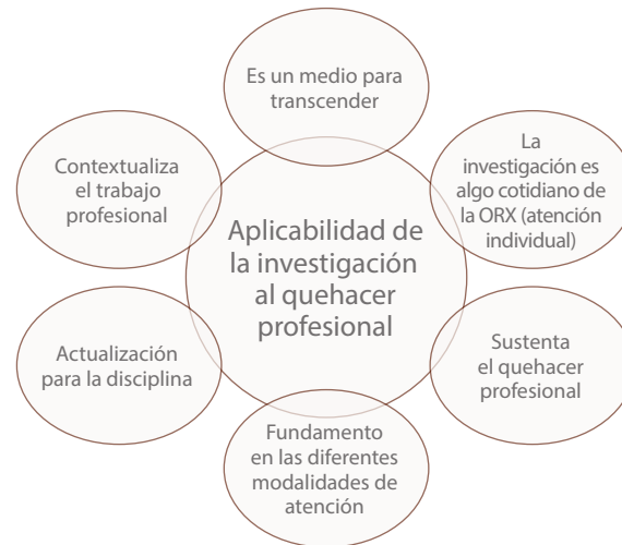
Figura 4: Aplicabilidad de la investigación en el quehacer profesional de Orientación

http://doi.org/10.15359/ree.24-2.13 ROR: https://ror.org/01t466c14 Universidad Nacional, Costa Rica http://www.una.ac.cr/educare educare@una.cr