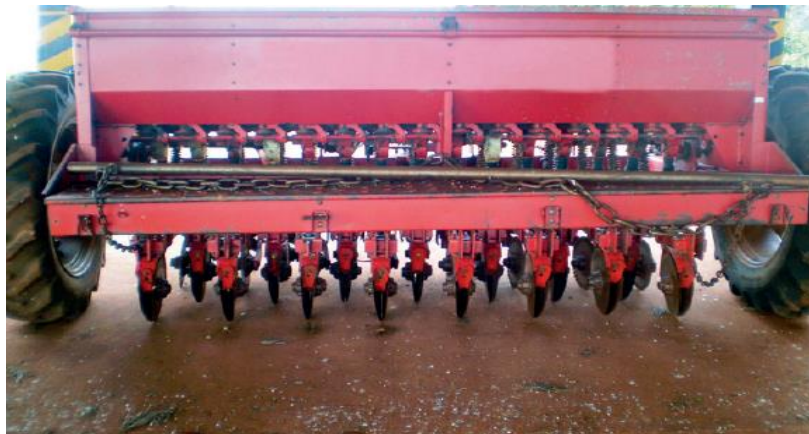
Figura 4 – Semeadora modelo TDA300.

Os rodados externos da semeadora traziam problemas em terrenos ondulados, o que levou posteriormente ao desenvolvimento da TDA300 (figura 4) com rodados articulados, se tornando a mais eficaz e popular (Junior et al., 2012).