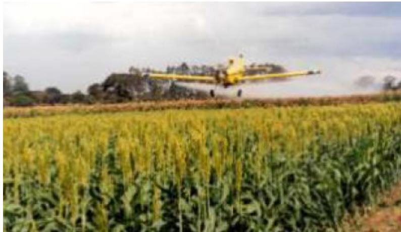
Figura 5 – Aplicação de herbicida dessecante na lavoura de milho.