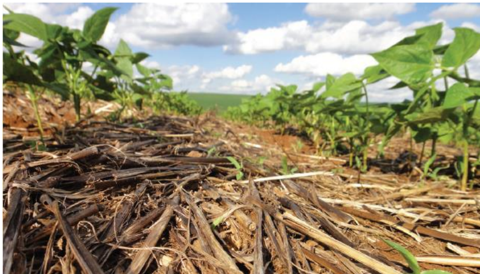
Figura 1 – Cobertura Morta advinda do processo de rotação de culturas.

De acordo com Alvarenga et al., (2001), a palhada deixada por restos de culturas advindas do processo de rotação de culturas, como pode ser observado na Figura 1, associado com os resíduos de material vegetativo das plantas de cobertura é uma das características do sistema plantio direto que proporciona o vigor da matéria orgânica no solo.