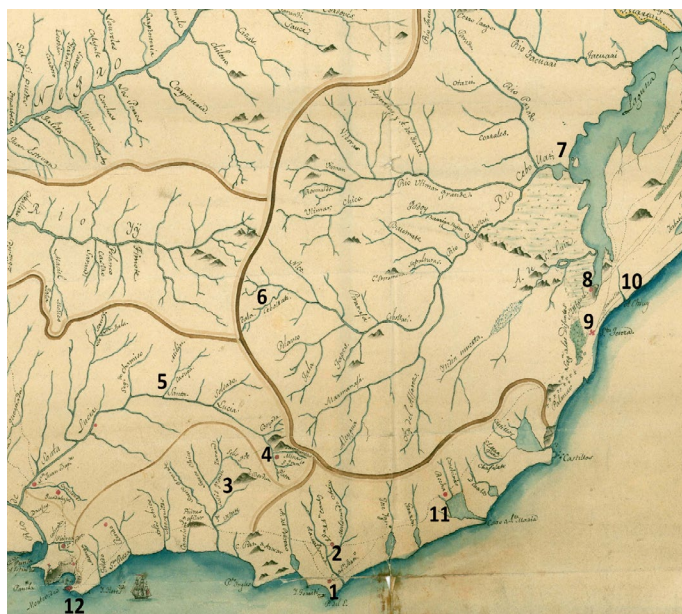
Figura 1. Pueblos de la frontera este del virreinato de Buenos Aires que conformaron en 1816 el departamento de Maldonado 19