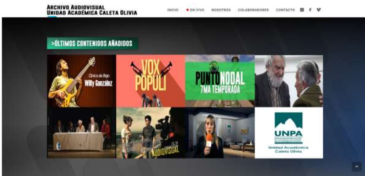
Propuesta de interfaz con botones según series producidas y catalogadas