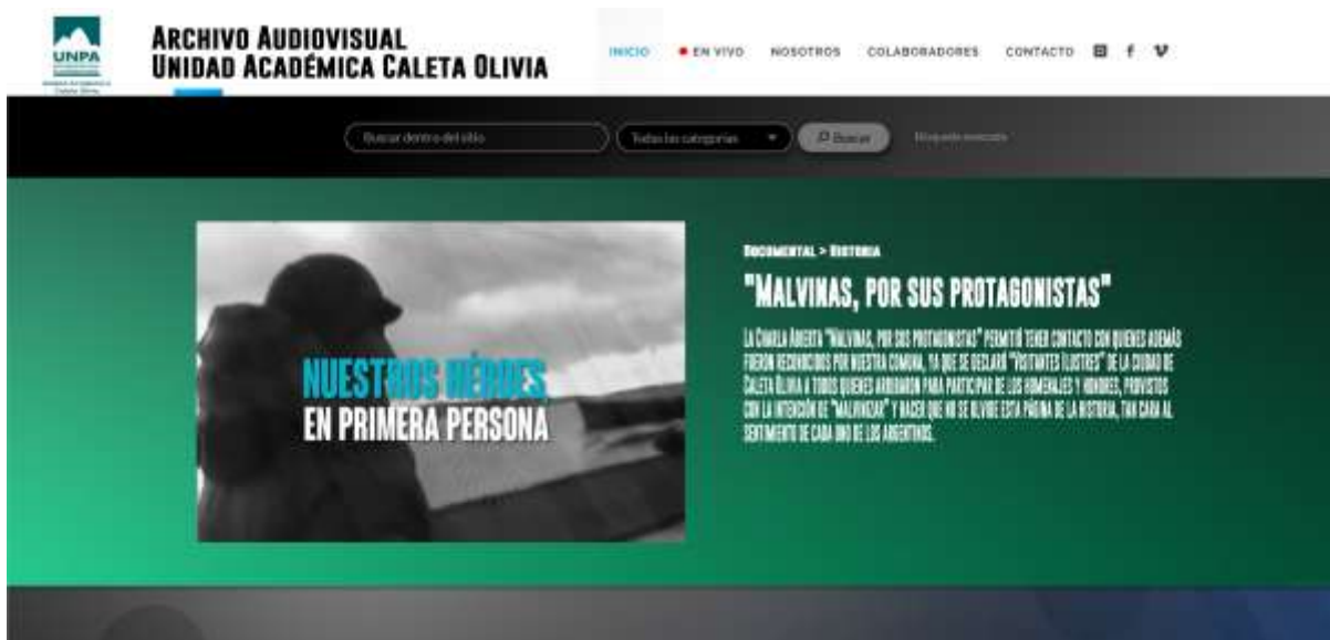
Propuesta de página de inicio