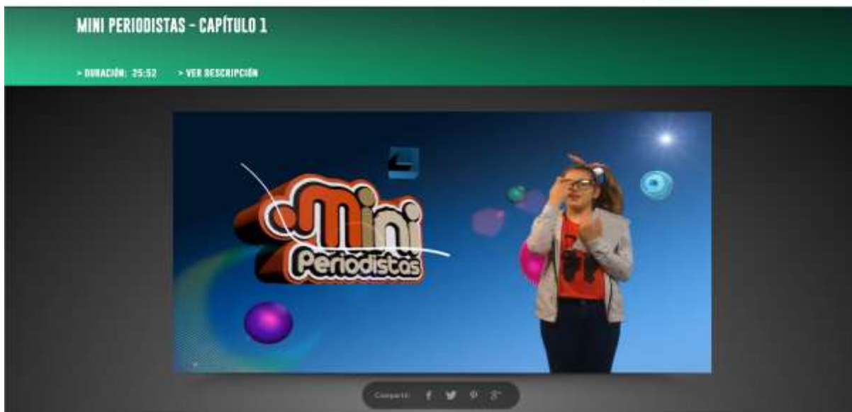
Propuesta de visualización de cada pieza