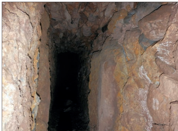
FIG. 3. Interior de la galería en sentido contrario al flujo de las aguas.

La tercera y última hipótesis contempla la riqueza hídrica de la rambla de la Tía Pereta, confirmada con su aprovechamiento a partir del caño inferior, para plantear la probabilidad de que el caño superior se alimentara, igualmente, por medio de un segundo minado que cap-