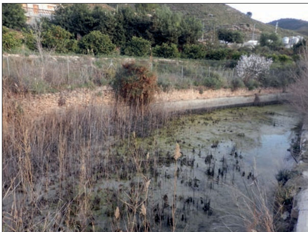
FIG. 8. Balsa de almacenamiento de las aguas del Caño de Inchola.

Inchola pertenecían a 8 propietarios, quienes actualmente han repartido su propiedad entre sus descendientes, incrementándose de esta forma el número de usuarios que tienen derecho al disfrute de las referidas aguas.