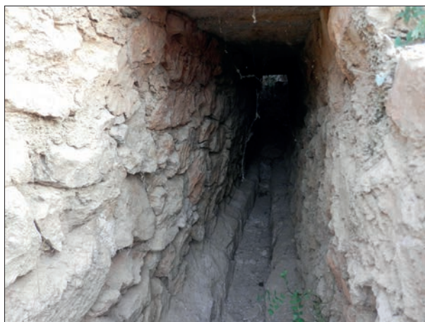
FIG. 7. Galería de conducción del Caño de Inchola.

ta y una balsa, aunque es evidente que debió de existir algún punto de captación cuya localización y características, como se ha señalado con anterioridad, se desconocen, descartando, probablemente, un origen común al del caño inferior.