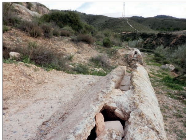
FIG. 5. Caño del Barracón (superior).

de realizar las tareas de construcción y mantenimiento de la misma (Fig. 3).