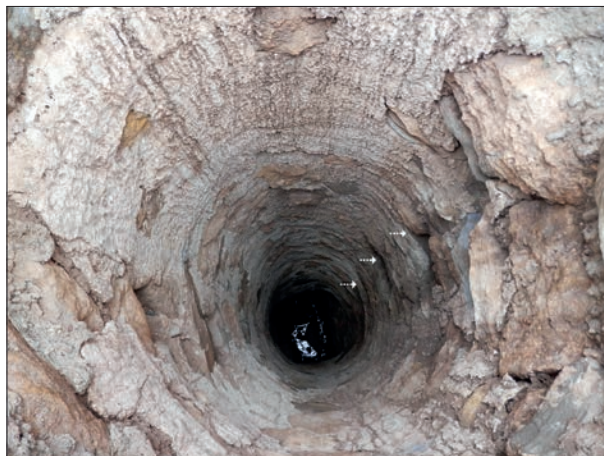
FIG. 2. Lumbera del Caño del Barracón (inferior).

No cabe duda de que la construcción de minados o galerías, con o sin lumbreras, ha sido una solución empleada como sistema de aprovisionamiento hídrico, tanto humano como agropecuario, en gran parte del territorio de la Región de Murcia, al menos desde época árabe según las evidencias constatadas, que no imposibilitan su aplicación también en época romana, considerando que los romanos ya conocían este sistema de captación hídrica. Por este motivo, son muchos los ejemplos de complejos hidráulicos de estas características identificados y estudiados por diferentes autores en toda la extensión del ámbito regional, cada uno de ellos con características y peculiaridades que los definen e incluso con denominaciones distintas 3 , aunque con un mismo objetivo: alum-