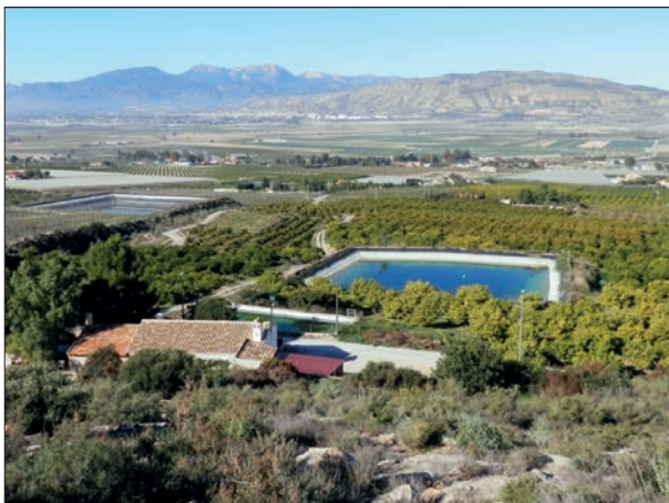
FIG. 4. Balsa nueva y embalse construido sobre la balsa antigua.