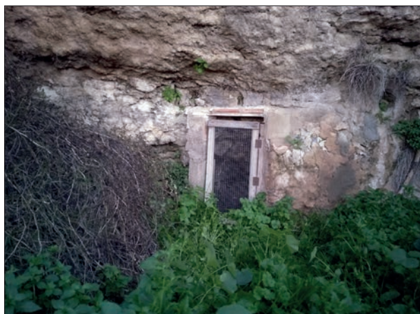
FIG. 6. Puerta de acceso al nacimiento de Inchola.