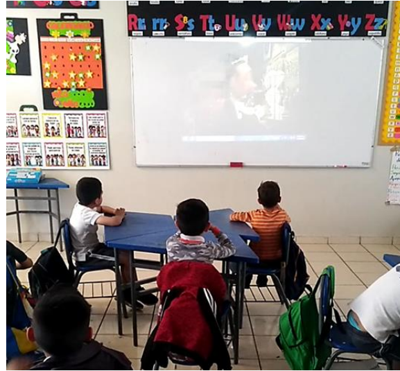
Figura 5. Evidencia de subsistema: sujeto-artefacto mediador- objeto.

En esta categoría se agrupan aquellas unidades de análisis que expresan la relación sujeto- artefacto mediador –objeto. Para la presente investigación esta relación se concreta en los siguientes elementos: alumno-cortometraje- comprensión lectora.