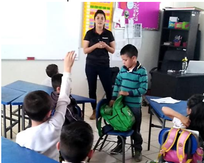
Figura 6. Evidencia de subsistema: sujeto- objeto- comunidad.

En esta categoría, las unidades de análisis expresan la relación sujeto-objeto- comunidad. En esta comunicación, planteamos la relación a partir de los siguientes elementos: alumno-comprensión lectora-clase.