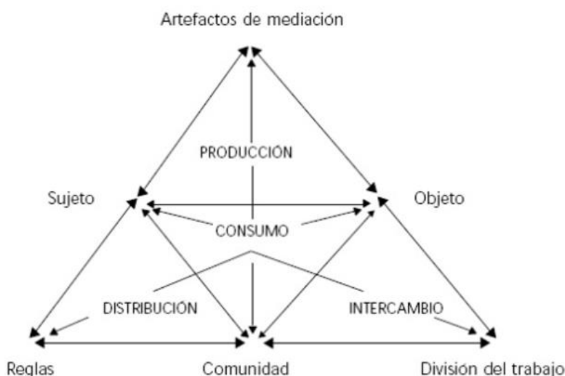
Figura 1. Triángulo del sistema de actividad según Engeström.

La clase entendida como el sistema de actividad planteado por Engeström, se recrea a partir de distintos subsistemas: producción, consumo, distribución e intercambio, como se plantea en la figura 1.