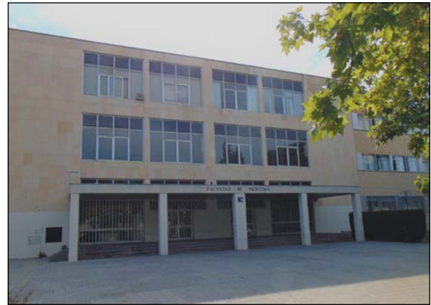
Figura 2. Actual Facultad de Medicina. Izquierda: Edificio «A», donde se imparten las clases y prácticas del primer ciclo del Grado y donde se ubica el Decanato y la Secretaría de la Facultad. Detrás al fondo está el Hospital Clínico Universitario «Lozano Blesa». Derecha: Edificio «B», donde se imparten las clases del segundo ciclo, incluidas las de Pediatría (2ª planta) y donde se ubica el Departamento (Despacho del Jefe de Departamento, Secretaría y Sala de Profesores).

la Escuela Profesional de Pediatría, donde se formaron 3 promociones de especialistas en Pediatría hasta 1978, año en el que se celebró el primer examen MIR a nivel nacional. Las actividades docentes presenciales pasaron entonces a la nueva Facultad de Medicina, situada al lado del Hospital Clínico y dentro del nuevo campus central de la Universidad de Zaragoza (figura 2).