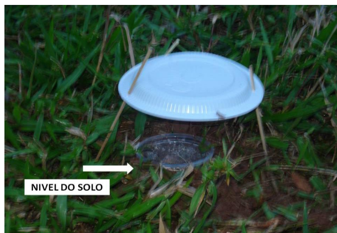
Figura 2 – Armadilha de queda.

As armadilhas desse tipo consistem, em geral, de um recipiente plástico enterrado ao nível do solo com solução para matar e conservar os animais capturados. Potes plásticos no volume de 500 ml podem ser utilizados para esse tipo de armadilha (Figura 2). De preferência utilizar pote que contenha tampa, pois o material coletado pode ser transportado facilmente da área experimental para o laboratório usando a própria armadilha. Uma maneira alternativa aos potes plásticos seria garrafas plásticas de refrigerante (2 litros), cortadas ao meio, sendo recomendando que se use sempre armadilhas de mesmo diâmetro nos diferentes locais para não interferir na eficiência da captura (PARR; CHOWN, 2001).