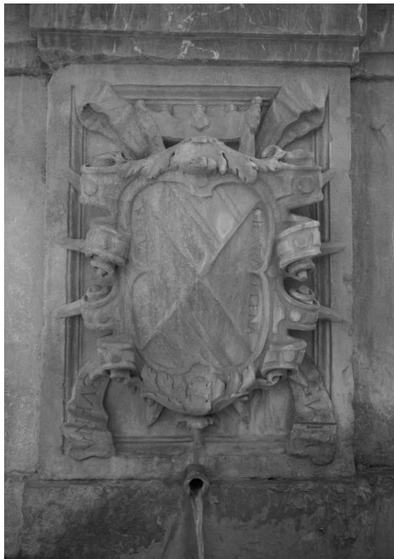
Figura 1. Escudo del II marqués de Mondéjar y III conde de Tendilla. Pilar de Carlos V, Alhambra de Granada.

De la importancia que tuvo esta misión tanto para los Mendoza como para don Íñigo obtenemos una idea gracias a los testimonios escritos y materiales que de ella se conservaron durante siglos en el linaje. 5