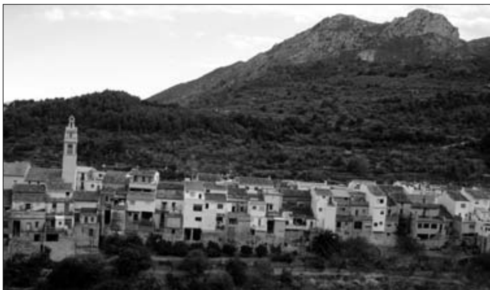
FOTO 1. Revitalización de los núcleos rurales situados en la zona A , próximos a la franja litoral (Vall de Laguar, Alicante).