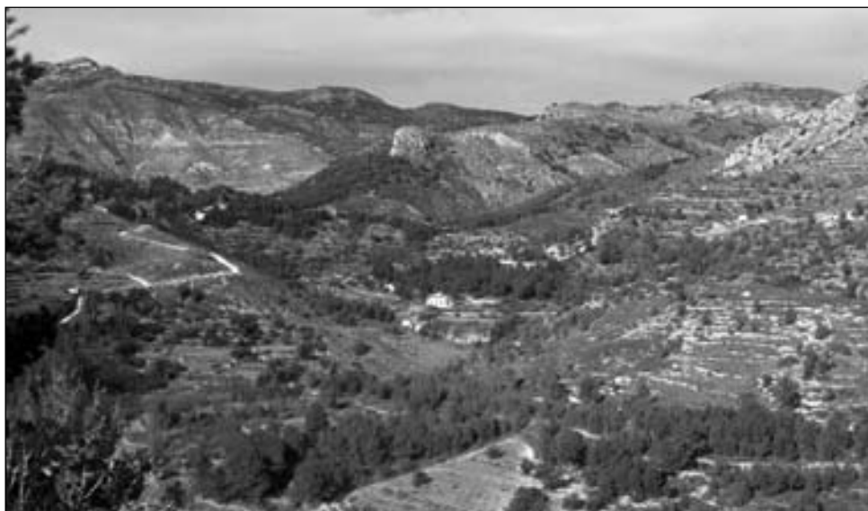
FOTO 2. Minifundismo e infragestión de los ecosistemas forestales en la zona B (L'Alcalatén, Castellón).

En algunos parajes la ordenación de los usos recreativos cuenta con una larga tradición, debido a la simbología histórica, paisajística y cultural que entrañan. Es el caso, entre otros, del «Carrascal de la Font Roja» (Alcoy). Sin embargo, junto a las actividades de tipo recreativo, excursionista, religioso y deportivo que tradicionalmente se desarrollan en estos lugares, no se ha producido un desarrollo paralelo de iniciativas vinculadas a las nuevas