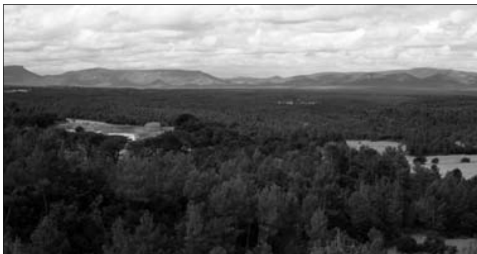
Foto 3. Regeneración y extensión de los ecosistemas forestales en la zona C (Los Serranos, Valencia).