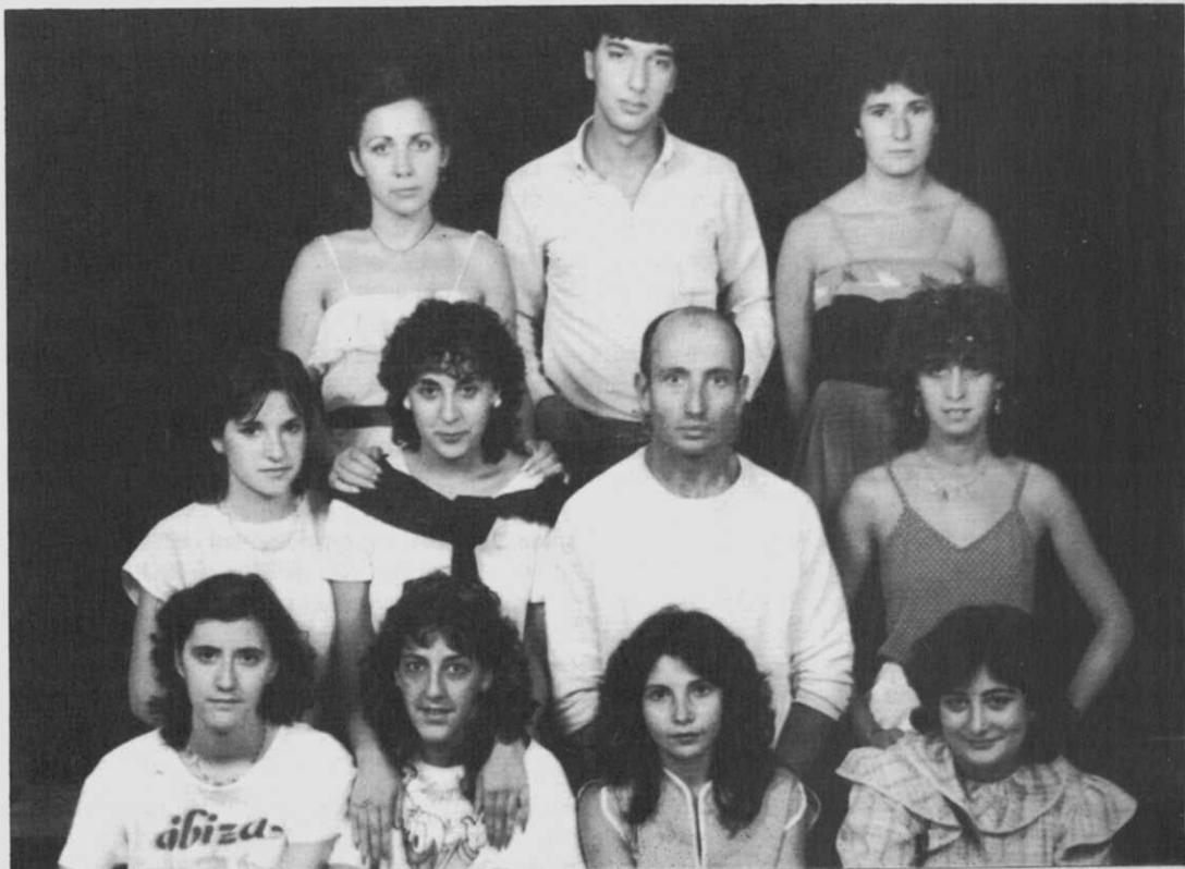
GRUPO DE TEATRO "BERROS"