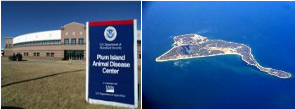
Laboratorio de investigación de enfermedades animales en EEUU - Laboratorio de Plum Island