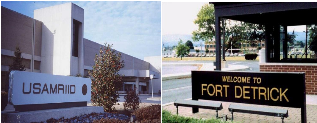
Instituto de investigaciones médicas en enfermedades infecciosas del Ejército EEUU

En 1995 las Naciones Unidas consiguieron acceder a las actividades de Irak para la producción de bombas biológicas. Finalmente en 2003, EEUU entra en guerra con Irak, con la principal justificación de no creer que éstos se hayan deshecho de todo su armamento biológico de destrucción masiva. Por otra parte, los servicios de Inteligencia tienen información de que son numerosos los países que tienen todavía en marcha trabajos para crear armamento bacteriológico. De ahí las llamadas de atención de los especialistas para hacer efectiva la labor de la Convención sobre Armas Biológicas y Toxinas.