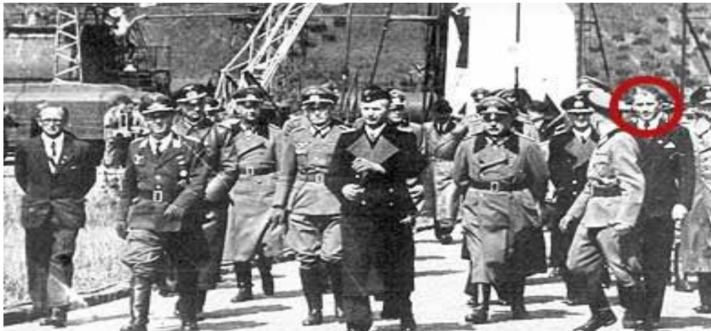
Los nazis en el Pentágono en la “Operación Paperclip”

Lo mismo ocurre en África, otro escenario caliente, en la actualidad, donde han crecido este tipo de laboratorios biológicos, donde su protección no está garantizada. En los últimos años, las pandemias de sida, tuberculosis y malaria, que castigan con especial virulencia el continente negro, han propiciado la proliferación de laboratorios biológicos, construidos por las grandes potencias, debido a la abundante cantidad de patógenos para la investigación con fines biomédicos. Sin embargo, los laboratorios del África Subsahariana carecen de sistemas de seguridad adecuados y los patógenos no están correctamente identificados, por lo que no es fácil determinar si implican un riesgo grave para la población. El material biológico que se manipula en estos laboratorios, puede caer en manos de terroristas que lo utilicen contra la salud humana, animal o vegetal, de tal forma que tienen la capacidad de provocar más muertes que en el pasado tenían las armas nucleares. Por ello habría que estrechar la vigilancia en los países de África del Este, donde existen numerosas células de Al Qaeda y es mayor el nivel de radicalización de algunos sectores de la población musulmana. África es sede de varios grupos terroristas y los ataques aquí y en el Magreb han puesto de manifiesto esa amenaza.