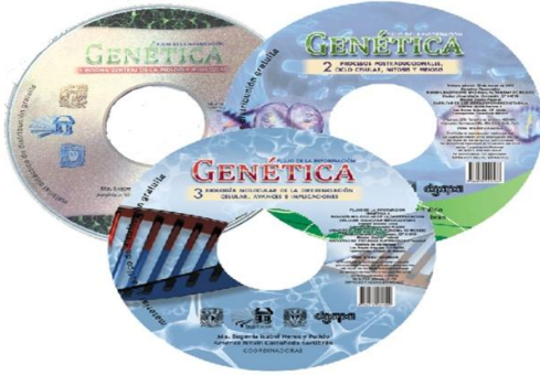
Secuencias genéticas en Internet