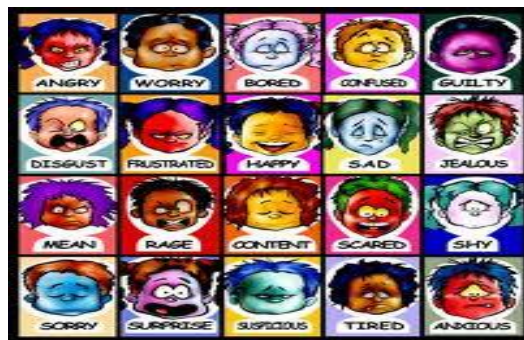
Diferentes razas y estados de ánimo

La utilización de estos microorganismos o sustancias tóxicas (toxinas) modificadas genéticamente, pueden ocasionar situaciones incontroladas, no solo para el que es atacando con ellas, sino también para el que las está utilizando como arma, ya que estos agentes pueden mutar, reproducirse en grandes espacios geográficos y ser extendidos por el viento, el agua, los vectores, los animales y por las personas. Esto es muy difícil de controlar y el riesgo es total para todos, aunque se hayan desarrollado vacunas (no olvidemos la posibilidad de mutación del microorganismo).