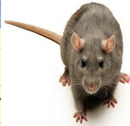
Vector transmisor Bacteria Yersinia Pestis