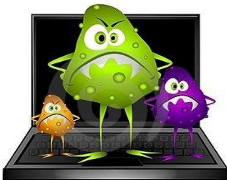
Información de patógenos por Internet

Existe una inquietud cada vez mayor en cuanto a un posible uso indebido de las informaciones genéticas accesibles por Internet. Es en la Red donde los científicos del mundo entero se informan mutuamente de los descubrimientos más recientes, y esas informaciones podrían ser interceptadas fraudulentamente por grupos privados. Los que proporcionan servicios por Internet tienen la obligación moral de velar porque no se pueda encontrar en sus sitios ninguna información técnica sobre armas biológicas.