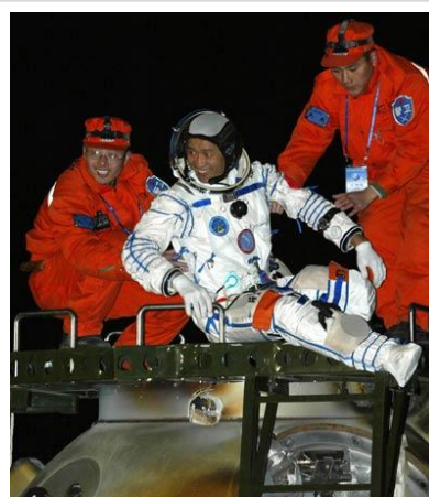
Nie Haisheng, piloto del segundo vuelo espacial tripulado chino

Algunos de éstos avances son el programa de caza indetectable al radar, el Chengdu J20 47 , actualmente en fase de pruebas de vuelo, la carrera espacial china, con la puesta en órbita de su propia estación espacial 48 , así como la construcción de su primer portaaviones, el exVaryag 49 soviético, de la clase Almirante Kuznetsov , comprado a Ucrania a través de una empresa turística domiciliada en Macao en 1998 y que se enmarca en la nueva estrategia china de Operaciones en Mares Lejanos 50 establecida por Hu Jintao para la Armada de la República Popular China. Todo ello nos descubre la genuina naturaleza de