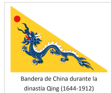
Bandera de China durante la dinastía Qing (1644-1912)

Al finalizar la II Guerra Mundial , La República de China y la finalmente denominada República Popular China se enfrentaron en una guerra civil que se apaciguó en 1949 tras el exilio del partido en el poder, el Kuomintang , a la isla de Taiwán. En ese momento el Partido Comunista de China proclama el gobierno de la República Popular China en Pekín mientras que el Kuomintang establece su capital en Taipéi. Desde entonces hasta 2008 la relación ha sido inestable 56 y marcada por constantes enfrentamientos militares a menor escala 57 .