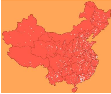
Localización de campos de concentración Laogai existentes en la República Popular de China (2010)

en la actualidad, que empuja con fuerza hacia una mayor integración política de los miembros de dichas instituciones.