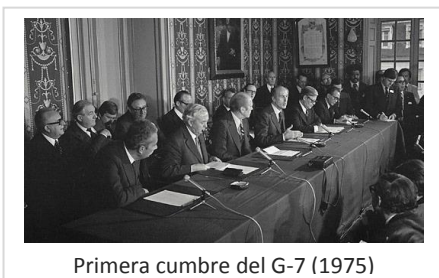
Primera cumbre del G-7 (1975)

Tras la crisis del petróleo de 1973 se hizo patente la necesidad de crear un organismo en el que quedaran representadas las mayores economías del mundo, que dispusiera de influencia financiera suficiente a nivel global como para intervenir en la dinámica económica mundial, con la meta de evitar crisis a nivel internacional.