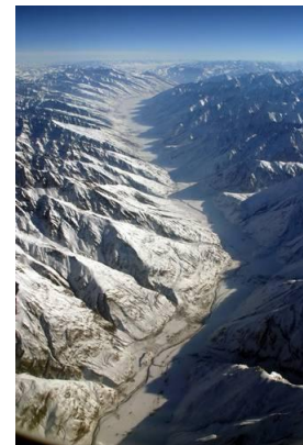
Fragmento del corredor Wakhan en Afganistán

Mención aparte merece Afganistán 91 , recientemente incorporado a la lista de aliados estadounidenses limítrofes con la República Popular China e importante ruta para los recursos energéticos procedentes del mar Caspio y Asia central en su camino hacia la India, Pakistán y China. En la frontera entre la RPCh y Afganistán se encuentra el paso Wakhjir , al Este del corredor Wakhan 92 , nexo físico entre ambos países que actualmente está cerrado 93 , no obstante varias empresas de la RPCh han comenzado a extraer en los últimos años recursos minerales en el país vecino, incrementándose lentamente los vínculos comerciales, a pesar de las dificultades provocadas por la destrucción del tejido productivo durante la última guerra 94 , librada a partir de 2001 95 . Asia-Pacífico es