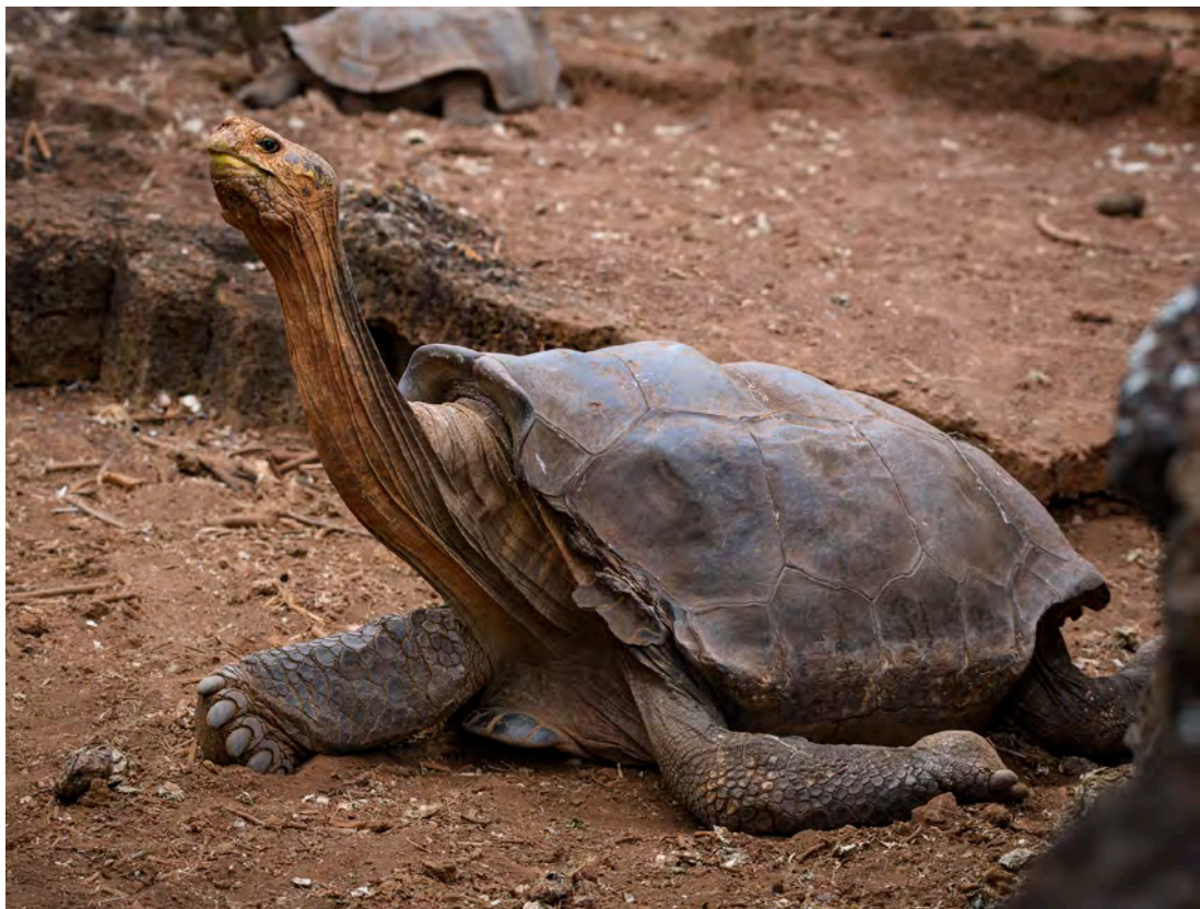
Diego es el macho de tortuga gigante de la Española ( Chelonoidis hoodensis ) que salvó a su especie.