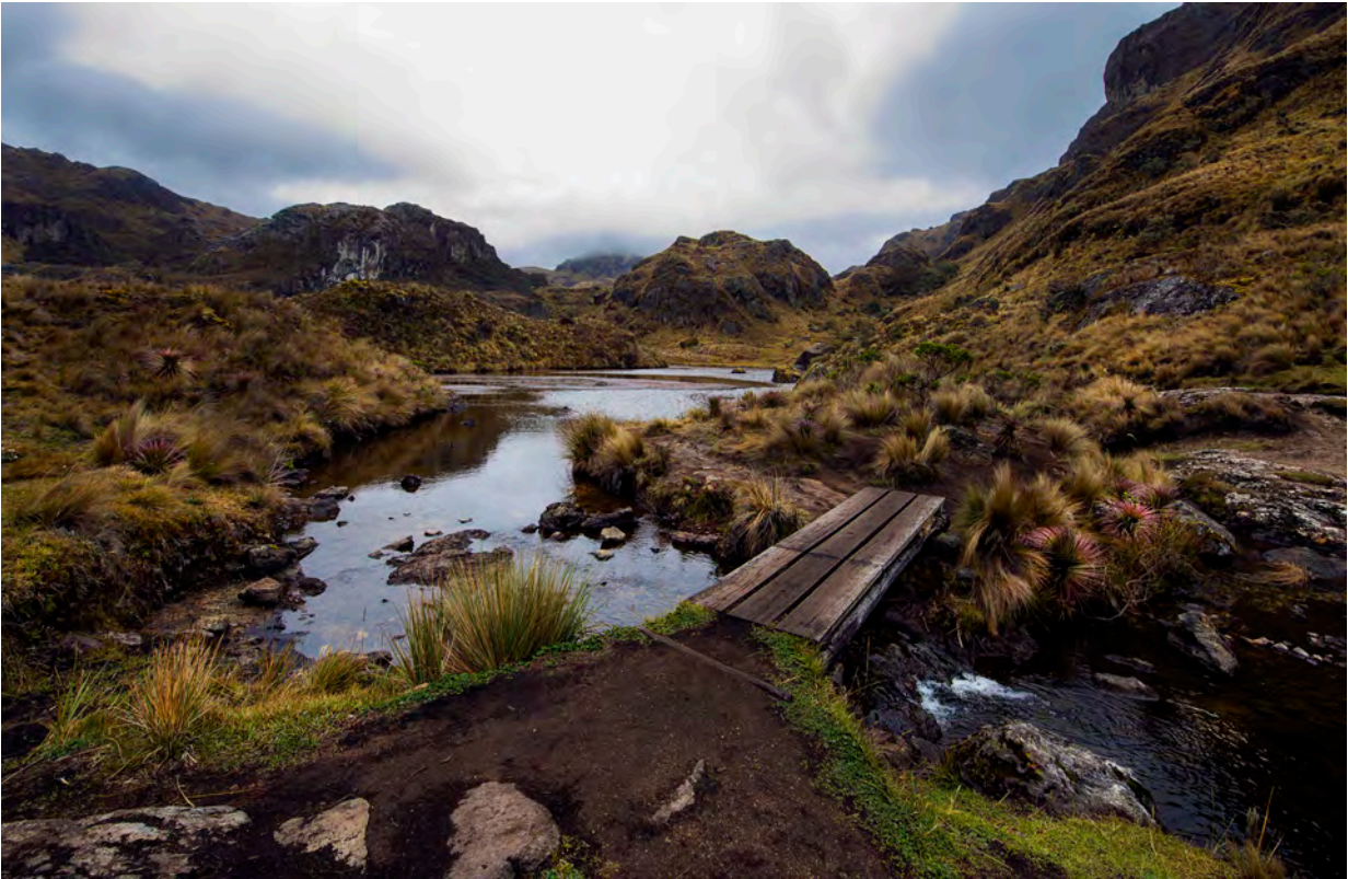
El Parque Nacional Cajas se ubica a gran altitud en la provincia de Azuay, al sur de Ecuador. Se caracteriza por sus extensas y particulares altiplanicies, donde se acumula agua en grandes cantidades –se calculan alrededor de 786 cuerpos de agua.