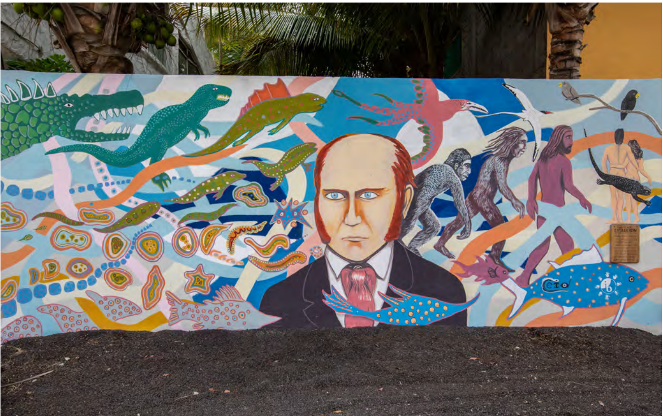
Mural de la evolución, en isla Isabela (Galápagos). Charles Darwin viajó en 1835 a las islas Galápagos, donde, inspirado por la observación de las distintas especies de pinzones e iguanas, desarrolló la teoría de la evolución.