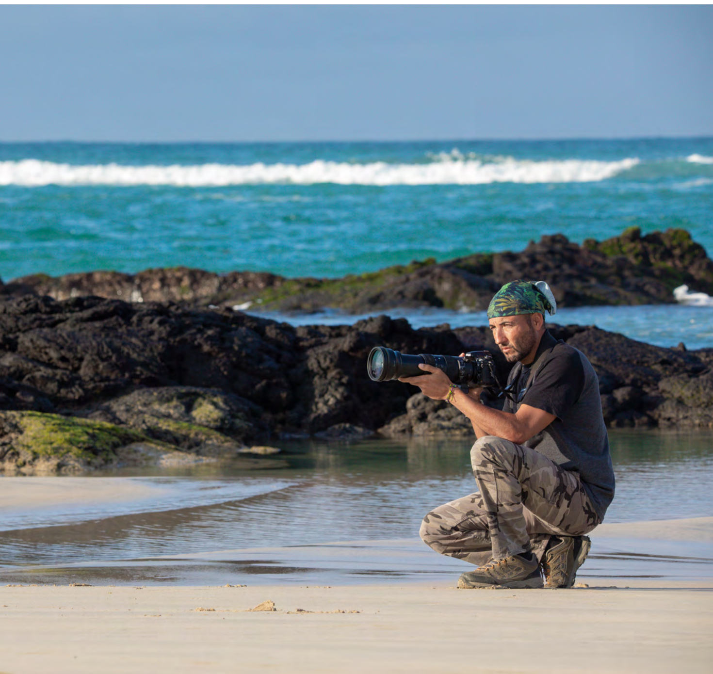
Las playas de Puerto Villamil (en las islas Galápagos) son un paraíso de arenas blancas y aguas turquesas. Ideales tanto para darse un baño o tomar el sol como para la observación de fauna silvestre (lobos marinos, iguanas marinas o piqueros de patas azules, entre otros).