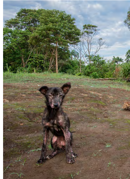
Las comunidades que habitan en el interior de la selva conviven con perros asilvestrados que, aunque son considerados uno más, sobreviven a duras penas a enfermedades e infecciones parasitarias.