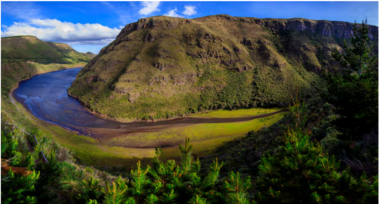
Laguna de Secas es uno de los principales atractivos para los turistas, especialmente para los andinistas y amantes de la naturaleza, pues, además de encontrarse en la ruta hacia la Reserva Ecológica Antisana, a menudo se puede observar el imponente cóndor andino sobrevolando este cañón.