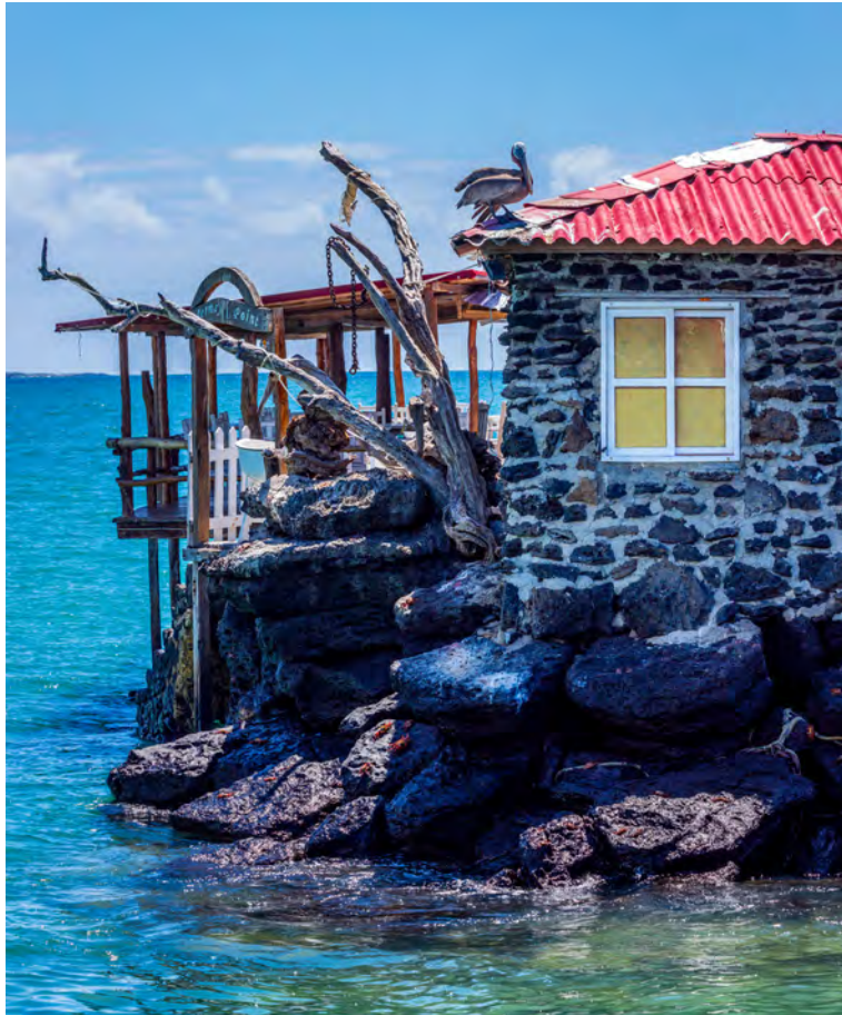
Las islas Galápagos muestran pintorescos rincones, como el que tomó prestado este pelicano pardo.