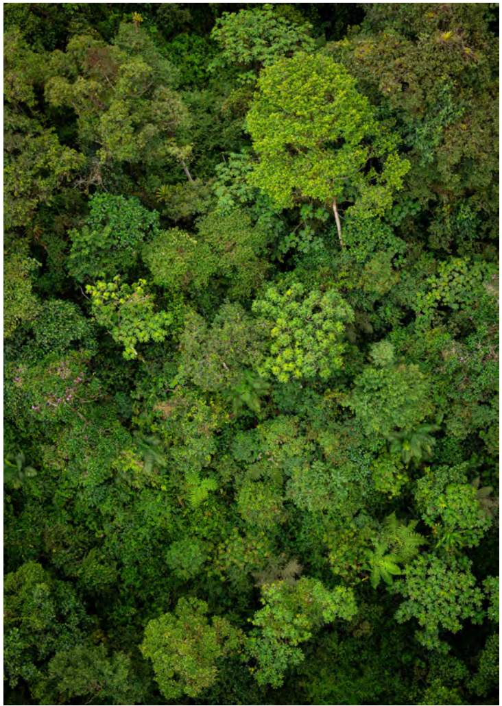
Vista aérea del verde y húmedo bosque nublado de Mindo.