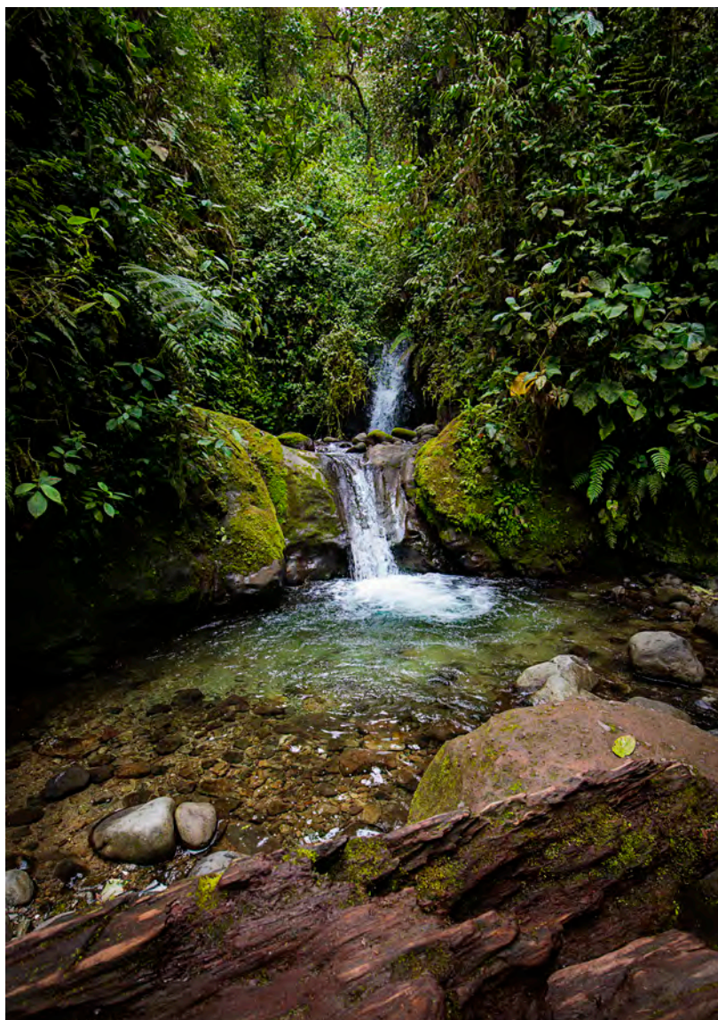
Una de las quince cascadas que se localizan en Mindo a lo largo de la ruta de las cascadas de la Reserva Ecológica Nambillo.