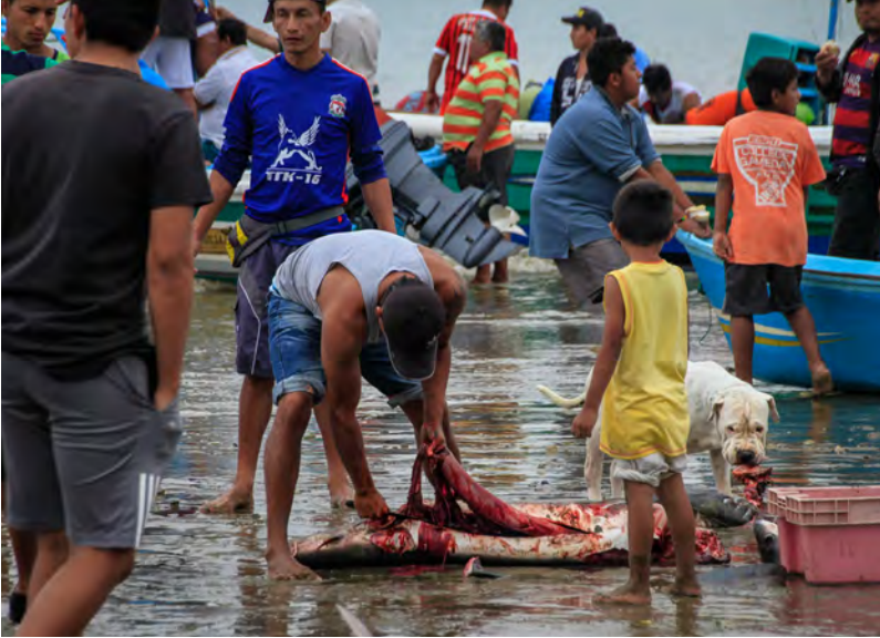
Puerto López es uno de los destinos más turísticos de Ecuador. A pesar de ello, una estampa llamativa y muy clásica se sigue produciendo cada mañana en sus playas, cuando los pescadores desembarcan todo tipo de capturas. Entre ellas, sorprende encontrar especies cuya pesca prohíbe la legislación del país, como son los tiburones.