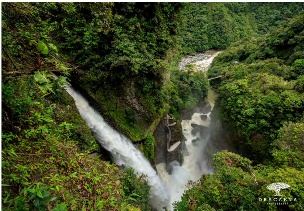
La cascada de río Verde –más conocida como Pailón del Diablo por la forma de las rocas, que aparentan el rostro del demonio– es uno de los destinos favoritos de los turistas.