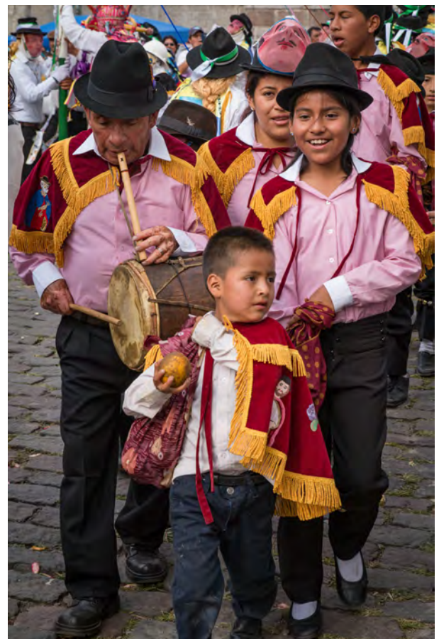
En Ecuador son innumerables las fiestas que muestran su interculturalidad combinando creencias indígenas y mestizas conservadas en la región andina. Este es el caso de la conmemoración religiosa del Corpus Christi y la Llegada del Inti Raymi en honor a Inti, el dios sol.