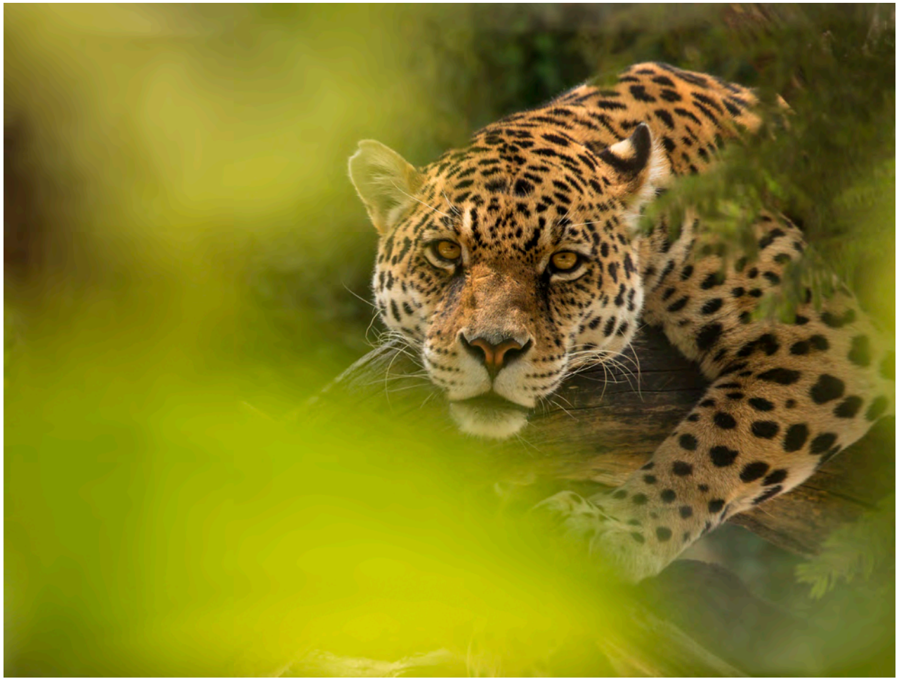
El jaguar (Panthera onca) –uno de los felinos más poderosos del planeta– se encuentra en las selvas de Ecuador.