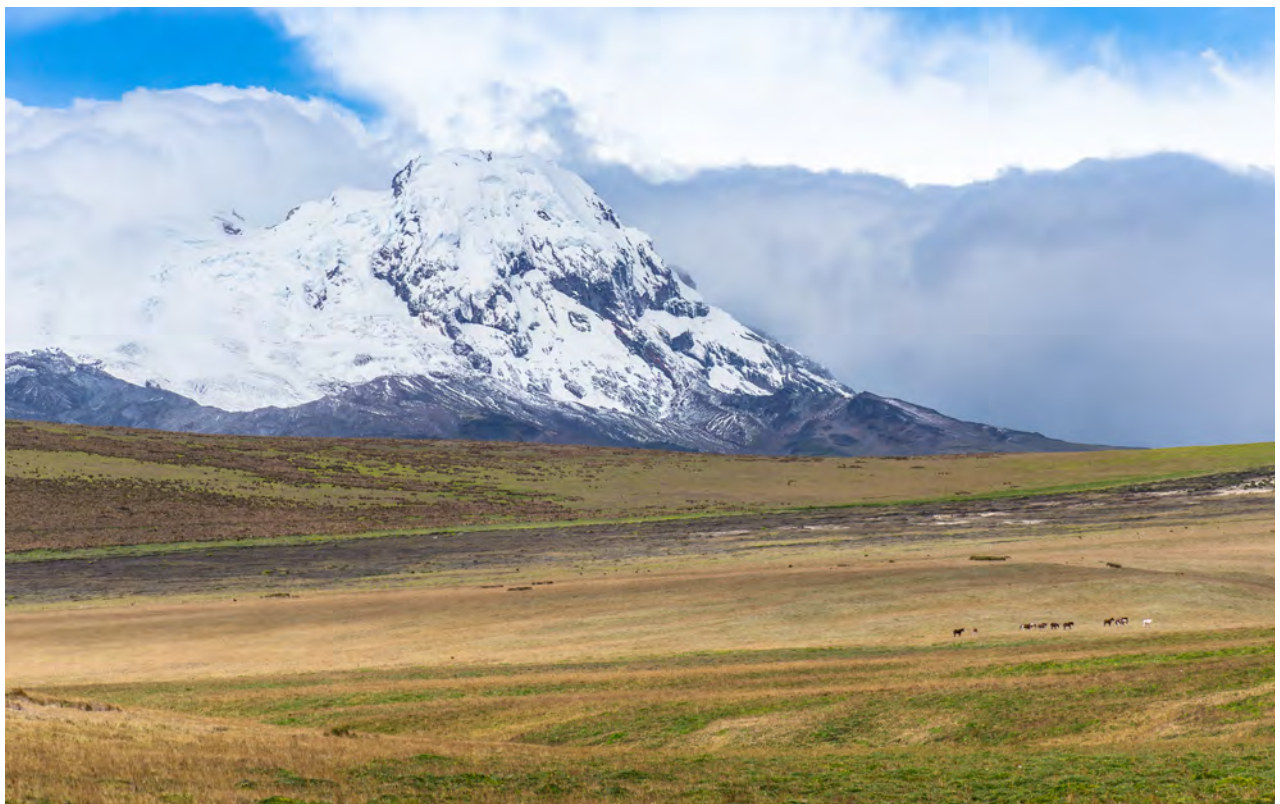
El volcán Antisana es uno más de los tantos volcanes activos de Ecuador. Se encuentra cubierto por glaciares, aunque el volumen de estos se ha reducido en más de un 35 % en las últimas décadas.