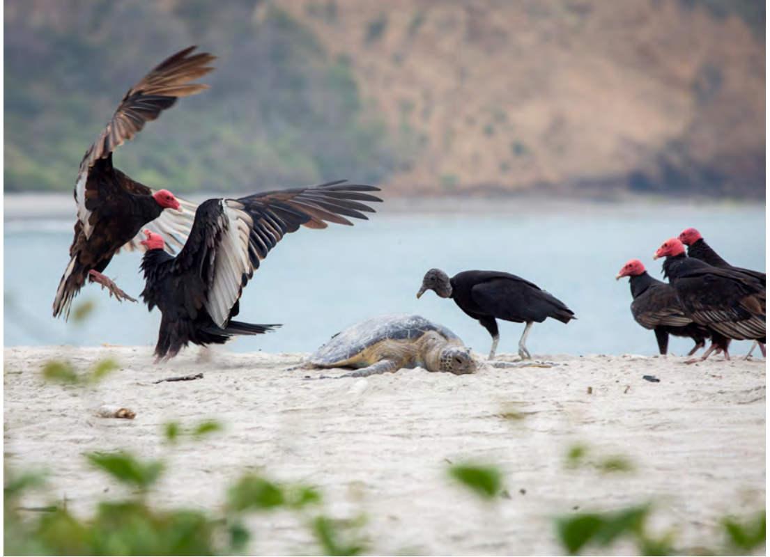
El cadáver de una tortuga marina sirve de festín a zopilotes negros y cabecirrojos en la turística playa de los Frailes, situada en el Parque Nacional Machalilla, de Manabí.