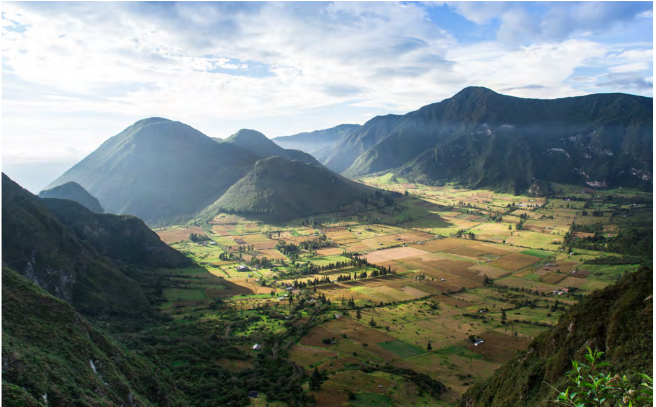
El cráter del Pululahua es de los pocos habitados –probablemente el único– en un volcán activo. Los primeros habitantes se asentaron allí en agradecimiento a su humedad y sus tierras fértiles. Hoy en día, la agricultura y la ganadería siguen siendo el principal medio de vida.