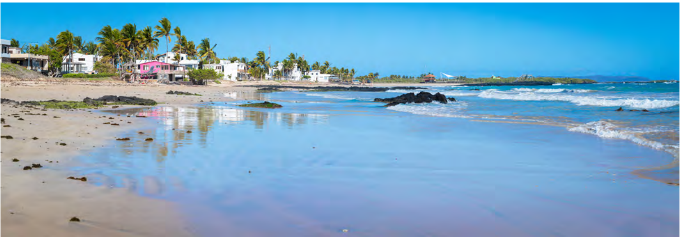
Puerto Villamil es el único núcleo poblacional de la mayor de las islas Galápagos, Isabela. La práctica totalidad de la isla se haya virgen e inaccesible, pero cada metro visitable hace honor al sobrenombre de las Islas Encantadas.