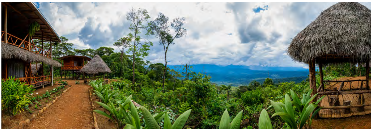
Las construcciones en zonas selváticas de Ecuador se realizan aprovechando los recursos a mano, como las cañas guadúa, madera y hojas de palmera.