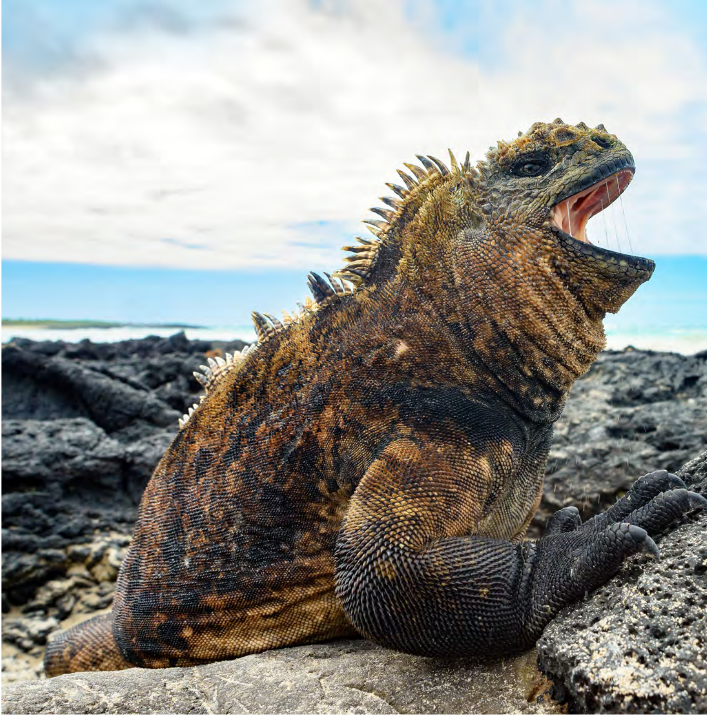
La iguana marina ( Amblyrhynchus cristatus ), endémica de las islas Galápagos, es el único reptil que basa su dieta en algas marinas.