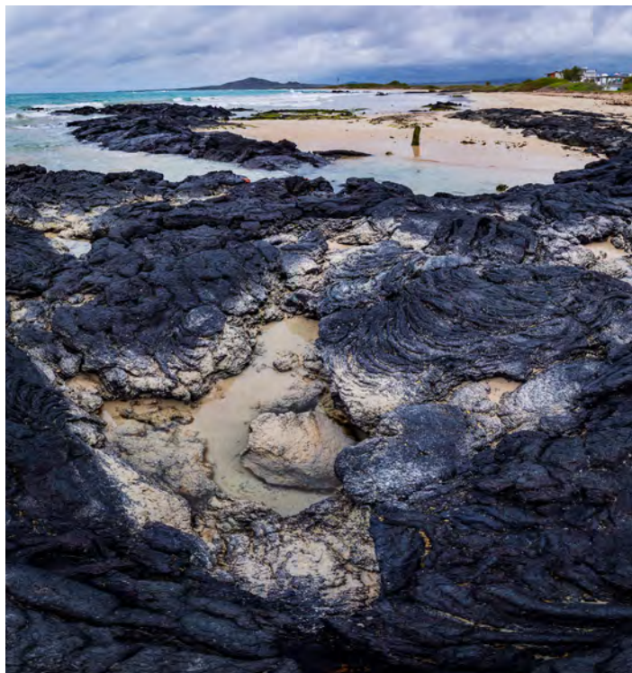
Las frecuentes erupciones de los volcanes de las islas Galápagos tuvieron como consecuencia que la lava alcanzara las costas. Hoy en día, su color negro contrasta con las claras arenas.