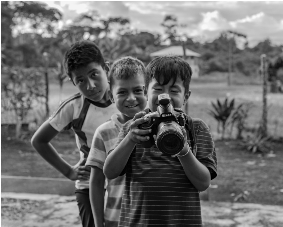
«De mayor quiero ser como el que aprieta el botón», nos decía el chico cofán que sostiene la cámara, quien probablemente no sabía que lo que deseaba era ser fotógrafo. El grupo étnico de los cofanes lucha por preservar sus costumbres mientras envía a los niños más pequeños a estudiar fuera de sus aldeas, con la intención de garantizarles un futuro «mejor».