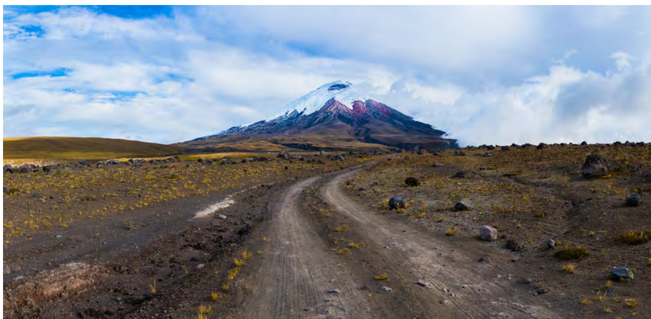
El volcán Cotopaxi es el segundo más alto de Ecuador, con casi 5.900 metros sobre el nivel del mar, y uno de los volcanes activos más altos del mundo. En su última erupción, en 2015, arrojó cenizas y humo, por lo que se declaró «alerta amarilla» en el país.