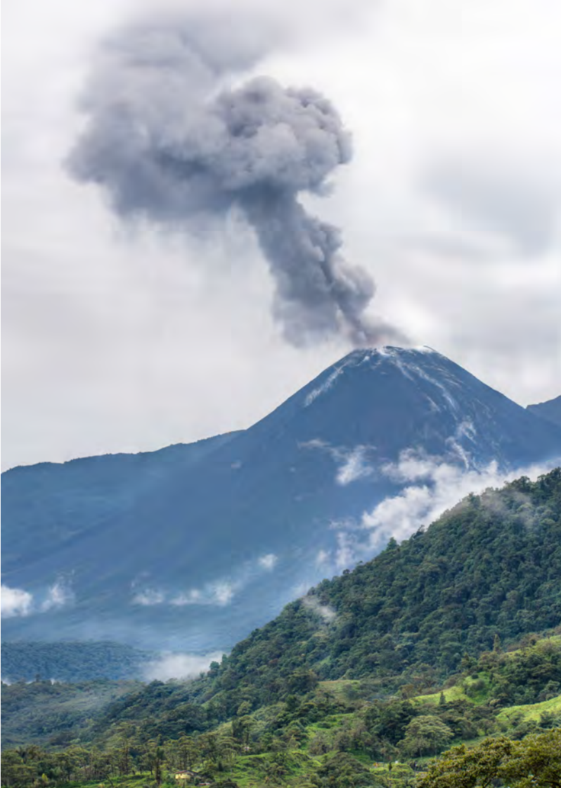
El Reventador es uno de los volcanes más activos del arco volcánico ecuatoriano. Su última erupción tuvo lugar en diciembre de 2017, cuando incluso emitió gases y lava, pero no llegó a suponer ninguna amenaza para las comunidades cercanas.