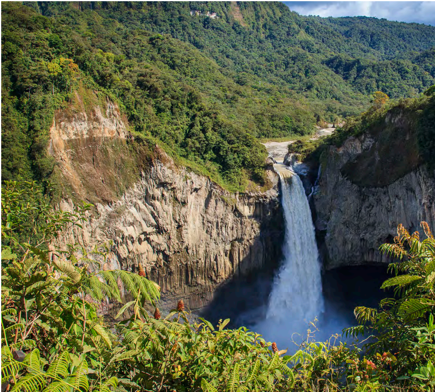
La cascada de San Rafael es la más alta de Ecuador, con casi 150 metros de caída.