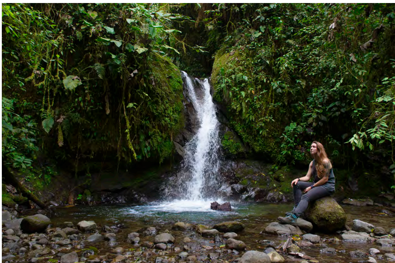
En Mindo se encuentra la Reserva Ecológica Nambillo, donde se pueden contemplar hasta quince cascadas.