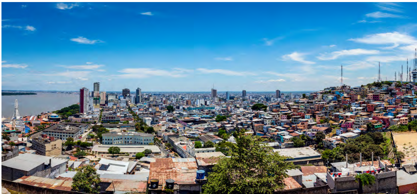
Una panorámica de la ciudad de Guayaquil (la segunda ciudad más poblada de Ecuador) nos muestra su enorme contraste arquitectónico, fiel reflejo de la sociedad ecuatoriana.