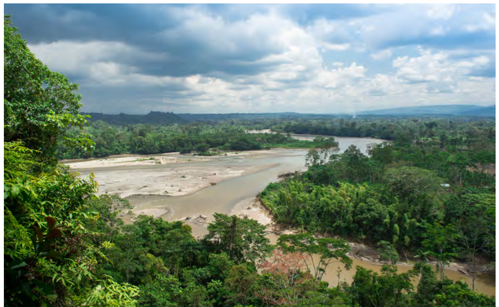
El río Napo nace en los glaciares del volcán Cotopaxi y es uno de los afluentes más importantes del río Amazonas.