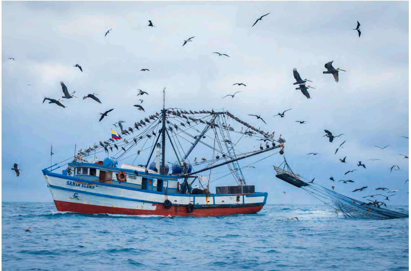
Cientos de pelícanos pardos, Fregatas magnificens y otras aves acuáticas se alimentan de los peces capturados por este barco pesquero en Puerto López.