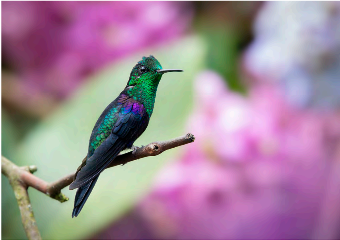
Macho de zafiro coroniverde (Thalurania fannyi), una de las aproximadamente ciento treinta especies de colibrí que habitan en Ecuador.