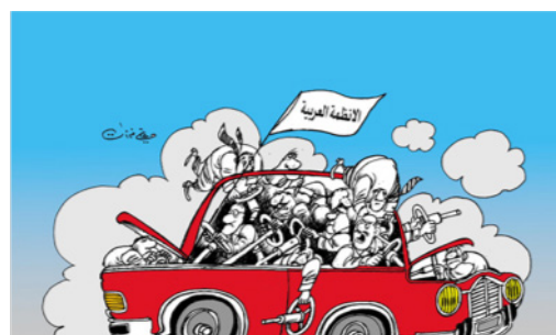
Los regímenes árabes (Farzat, s. d.) 5 .