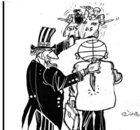
Coalición contra el Daesh (Ferzat, 2014) 15 .

queta más arreglados para representar a las élites, mientras que, por otra parte, con los trajes rasgados y harapientos representan a la sociedad. Además, emplean la kufiya para representar a los ricos, así como el turbante iraní y el gorro del Tío Sam para hacer hincapié en la política internacional. Del mismo modo, con el traje de general y las barbas indican miedo y respeto desde el punto de vista de la política local (Qassim, s. d., pp. 37-43).