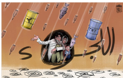
El tiempo (Ahmad, 2017) 14 .

Por otro lado, los personajes son símbolos en sí mismos. Tienen a exagerar la expresión para enfatizar la crítica. Esto mismo también lo reflejan en la vestimenta. Se observa que usan trajes de cha-