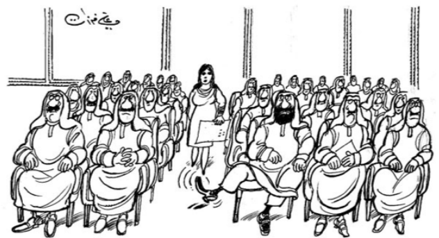
La mujer como víctima social (Farzat, s. d.) 11 .

En cualquier caso, los niños no son los únicos personajes utilizados para criticar la sociedad. Los caricaturistas árabes utilizan a la mujer para hacer hincapié en la desigualdad social. Aparece como víctima teniendo en cuenta varias perspectivas. Por un lado, se refleja como víctima de la sociedad oprimida por el hombre y, por otro lado, se muestra como madre de la sociedad que ha sido maltratada hasta límites extremos (Qassim, s. d., p. 52).