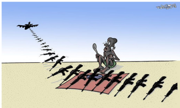
África y el comercio de armas (Reslan, 2016) 13 .

Por otro lado, destacan las armas para representar la guerra y las operaciones militares. Los caricaturistas quieren hacer hincapié en la situación en el mundo árabe, por lo que las armas es un elemento clave. En un primer momento este símbolo solía asociarse a Israel y al comercio de armas, pero con el desarrollo de la Primavera Árabe evolucionó y se empezó a asociar sobre todo a las guerras y a los conflictos armados (Qassim, s. d., pp. 55-61).