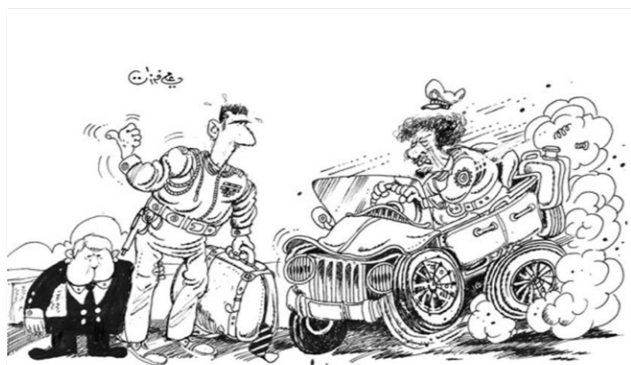
Muammar al-Gadafi y Bashar al-Asad escapando juntos (Farzat, s. d.) 17 .

Más allá de todo esto, destaca Ali Ferzat. Este ya había sufrido ataques de la censura por parte del gobierno sirio tras el estallido de la Primavera Árabe. La noche del 25 al 26 de agosto de 2011 volvió a ser atacado por parte del gobierno sirio: le rompieron los dedos y lo dejaron semiinconsciente. En cualquier caso, logró salvar la vida y recuperarse en Kuwait (Farzat, 2012).