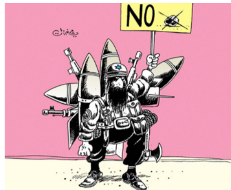
El soldado israelí con barba (Farzat, s. d.) 8 .

era muy sencilla de interpretar, porque era conocida por todos, y permitía comprender fácilmente lo que ocurría en estos dibujos. No obstante, los caricaturistas crearon una simbología específica que permitía identificarlos con mayor claridad, pues, entre otras cosas, hay que tener en cuenta que cada caricaturista es hijo de su tiempo y que su propia simbología forma parte de ellos como algo natural. Aun así, todos comparten también unos símbolos que hacen que este arte se convierta en un género propio dentro del mundo árabe (Flores, 2017a, pp. 243-268). El primero de estos símbolos comunes que se destaca es la estrella de David. Es el símbolo de la bandera de Israel y la utilizan para criticar la situación entre Israel y Palestina. De hecho, muchos lo enfatizan hasta tal punto que equiparan Israel con un Estado tirano y terrorista por las vejaciones que comete (Qassim, s. d., pp. 44-47).