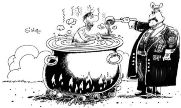
El oficial cocinando al ciudadano (Farzat, s. d.) 7 .

En cualquier caso, la caricatura más extendida es la caricatura global. Este tipo de caricaturas mezcla los problemas sociales con los problemas políticos. Por tanto, su uso es bastante recurrente, ya que transmite muchas ideas y pensamientos mantenidos en la sociedad con solo una imagen (Azīz Alī, 2010).