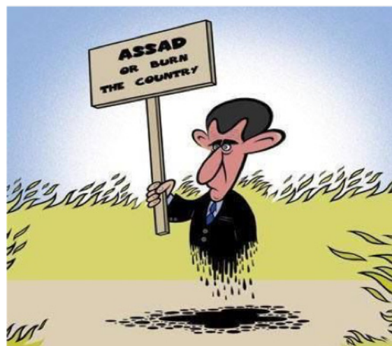
Bashar al-Asad (Abou Hassan-FadiToOn, 2015) 16 .

Además, este hecho contribuyó a ejercer una fascinante influencia sobre los jóvenes sirios que se reunían los jueves para preparar pancartas, en las que incluyeron diferentes caricaturas para llevarlas a las manifestaciones de los viernes. Esto empezó como un juego en el que los chavales llevaban sus dibujos en señal de protesta y a la gente le fue gustando cada vez más, hasta tal punto que este juego se convirtió en una vocación (Flores, 2018b, pp. 128-129). Estos dibujos esbozaban los acontecimientos que estaban sucediendo en las calles y su objetivo era incitar a la población a que reaccionara contra los diferentes regímenes. Así, utilizaron estos dibujos para fomentar la ira contra los dictadores y para que la sociedad saliera a las calles para pedir paz y libertad. Por tanto, la caricatura terminó de evolucionar durante la Primavera Árabe, convirtiéndose en un símbolo de la revolución (Kushkush, 2013).