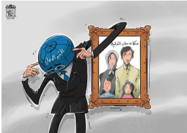
La comunidad internacional (Ahmad, 2016a) 9 . Además, destaca el uso de los niños.

Los niños representan la inocencia y la pureza, por lo que van a ser representados como víctimas. Son el elemento más débil de la sociedad, dado que todas estas circunstancias repercuten en su crecimiento y ellos serán los adultos del futuro. Por tanto, cuando aparecen en las caricaturas es con el fin de destacar las consecuencias que tendrán todos los conflictos en el mundo árabe y en Oriente Medio (Qassim, s. d., p. 52).