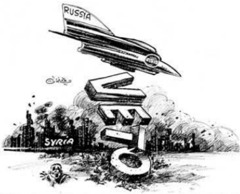
El veto a Siria (Farzat, s. d.) 6 .

En cualquier caso, la caricatura más extendida es la caricatura global. Este tipo de caricaturas mezcla los problemas sociales con los problemas políticos. Por tanto, su uso es bastante recurrente, ya que transmite muchas ideas y pensamientos mantenidos en la sociedad con solo una imagen (Azīz Alī, 2010).