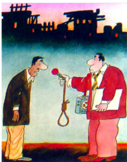
La falta de libertades en la sociedad (Farzat, s. d.) 2 .

En primer lugar, la caricatura social se caracteriza por criticar los males sociales. Trata temas relacionados con la conducta social, tales como los chismes o el acoso por parte de los gobiernos; pero este tipo de caricaturas también trata temas relacionados con los asuntos burocráticos y administrativos. Por tanto, el tema social busca resaltar los valores negativos, haciendo que la gente reaccione ante determinadas situaciones (Aziz Alí, 2010).