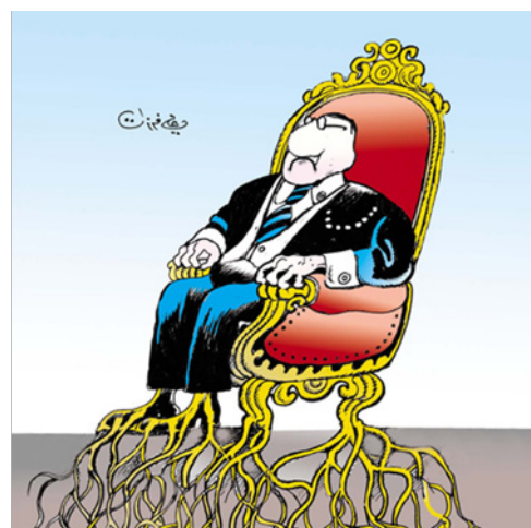
El encauzamiento del trono (Farzat, s. d.) 4 .

Por otro lado, hay una caricatura que critica temas políticos. Dentro de la caricatura política, se critica la política local, la política árabe y la política internacional. En este sentido, la crítica que los caricaturistas realizan de la política local está orientada a la política interior de cada país, dado que trata temas políticos nacionales y las cuestiones generales del gobierno; mientras que la política relacionada con el mundo árabe en general se utiliza para criticar la falta de panarabismo político, así como la sátira referida a la política internacional se refleja en críticas a la política exterior, en tanto que no hacen nada para resolver los problemas de Oriente Medio (Aziz Alí, 2010).