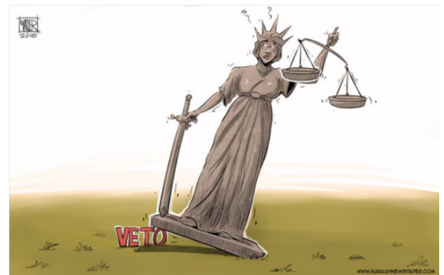
El secuestro de la justicia y la libertad (Ahmad, 2016b) 12 .