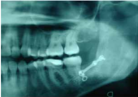
Figura 6. radiografía donde se aprecia osificación ósea y radiopacidad compatible con mini placa de osificación mandibular.

La imagen corresponde a una semana posterior a cirugía. A los 30 días se realiza Rx. de control donde es claramente visible la consolidación total del injerto. A los 6 meses de cirugía no hay evidencia de recidiva quística y cicatrización total del injerto, figura 6.