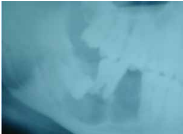
Figura 3. Radiografía con zonas radiolúcidas en zona posterior.

El día 21 de diciembre de 2014 acude al Instituto de Cirugía Oral y Maxilofacial un paciente masculino de 23 años de edad con tercer molar inferior derecho retenido y radiográficamente presenta imagen radiolúcida de grandes proporciones.