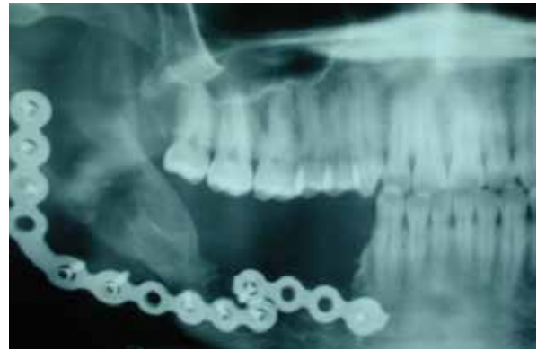
Figura 4. radiografía de control con radiopacidades compatibles con placas de fijación ósea. Fuente: Instituto de Cirugía Oral y Maxilofacial, Guayaquil.

El paciente presenta necrosis pulpar de premolar y se remite a odontóloga que no realiza tratamiento de endodoncia, dando como resultado un absceso apical y por consiguiente propagación del cuadro infeccioso a través del hueso neoformado. Se realiza exodoncia de premolares, secuestrectomía, curetaje y se decide colocar una placa de reconstrucción más superior para afianzar el tejido neoformado. 3 meses después se toma rx de control y se aprecia que todavía no se tiene una osificación completa.