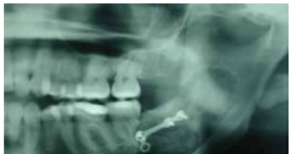
Figura 5. Radiografía con presencia de radiolucidez con bordes definidos compatible con quiste mandibular.

El 23 de mayo de 2014, acude al Instituto de Cirugía Oral y Maxilofacial un paciente de 60 años que presenta imagen radiolúcida a nivel de tercer molar inferior izquierdo. El resultado histopatológico demuestra que se trata de quiste dentígero. Se programa quistectomía más relleno del defecto con injerto de hueso de banco mezclado con plasma enriquecido en plaquetas. Se fijará nuevamente la cortical con miniplaca y tornillos de titanio. Figura 5