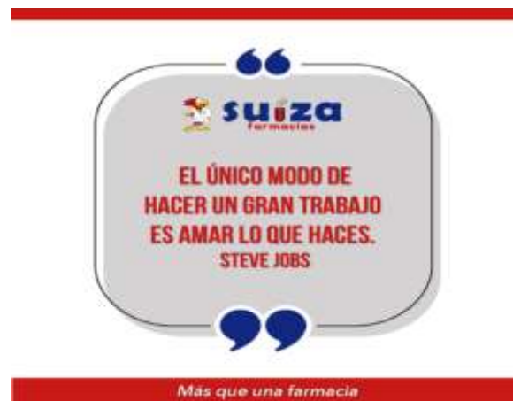
Figura 8: Frases motivacionales.