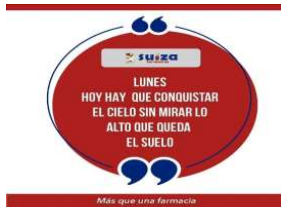
Figura 7: Frases motivacionales.

empresa que a más de su salud, se preocupa por su bienestar emocional y su integridad. Como se muestra en la Figura 7 y en la Figura 8.