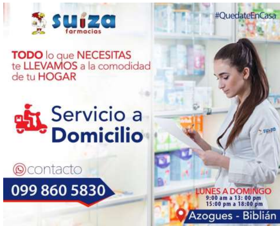
Figura 6: Publicación de horarios de atención de Cadena de Farmacias Suiza. Fuente: Elaboración propia

El objetivo principal de esta estrategia es utilizar los medios digitales como son las redes sociales, y otras aplicaciones que brinda el internet para mantener informados a los clientes de cadena de farmacias suiza, de la misma manera se pretende fomentar la comunicación mediante los mensajes en línea para solventar cualquier duda, inquietud o requerimiento que pueda tener el usuario. Como se observa en la figura 8, se comunica a los clientes el horario de atención y números de contacto para facilitar el pedido de los productos a domicilio.