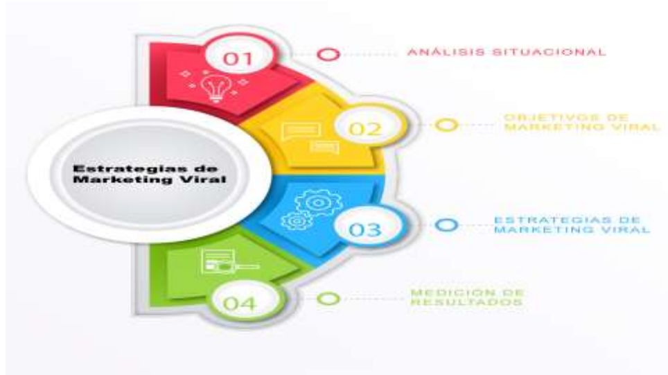
Figura 1: Estrategias de Marketing Viral.

La estructura de la propuesta de estrategias de marketing viral se presenta a continuación en la figura 1.