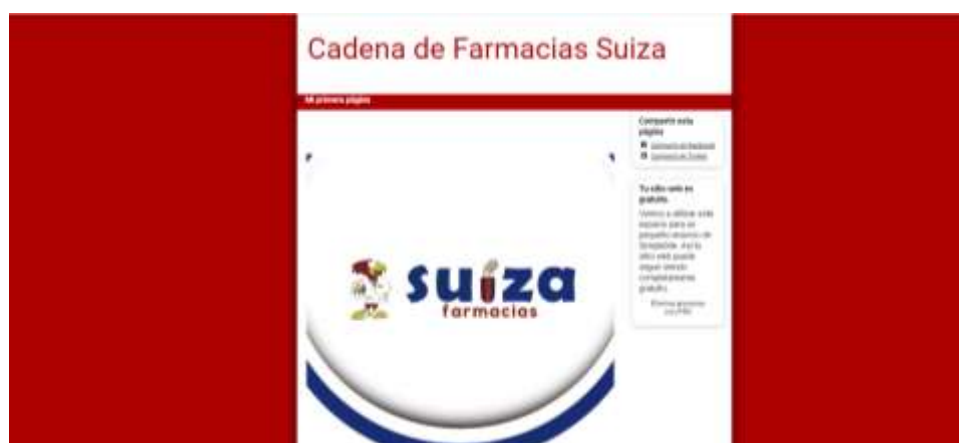
Figura 5: Página web de Cadena de Farmacias Suiza.