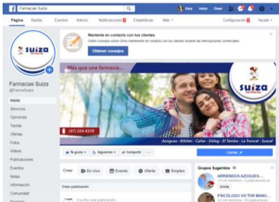
Figura 3: Fan page de Cadena de Farmacias Suiza.