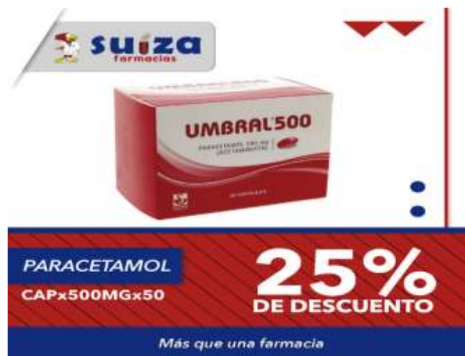
Figura 4: Promociones de Cadena de Farmacias Suiza.

Por otro lado, la fan page se utiliza para que el cliente pueda conocer los productos, precios y promociones que tiene cada semana cada de farmacias suiza, debido a que todas las semanas tienen 6 productos que están en promoción.