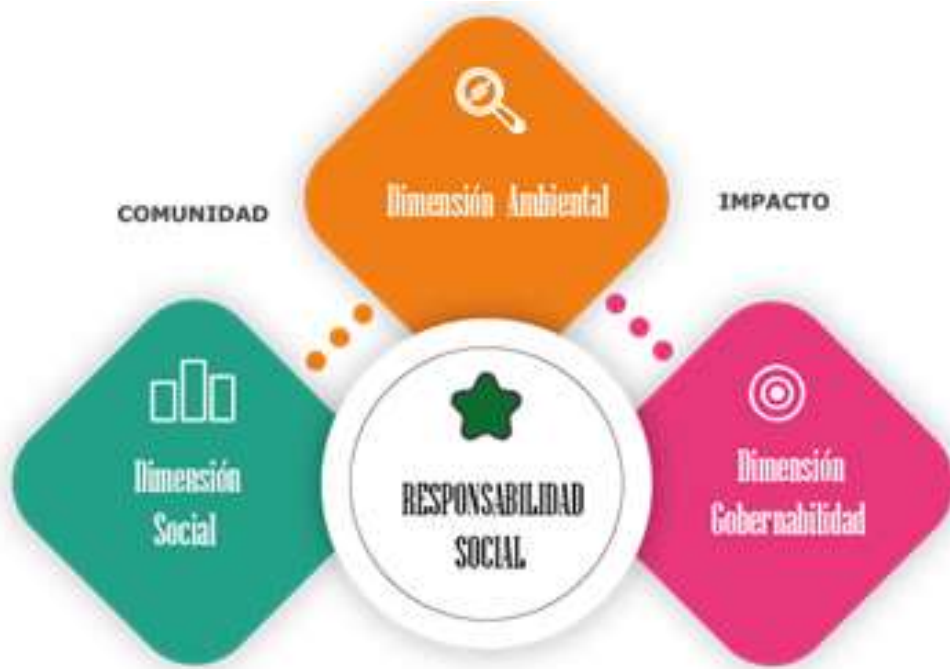
Figura 2. Propuesta de cumplimiento responsabilidad social.

Para dar cumplimiento al objetivo proyectado en este proceso investigativo, como se aprecia en la Figura 2, se propone desarrollar un plan de análisis de responsabilidad social en base al cumplimiento que tienen las empresas destinadas a la industria del camarón, niveles o tipos de certificación internacional, características que destacan su nivel de cumplimiento con el medio ambiente, la comunidad y sus trabajadores.