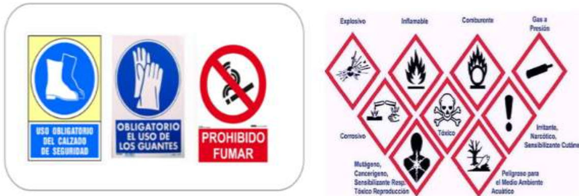
Figura 4. Señalización de prevención

En la figura 4 se presentan las señaléticas respectivas de prevención sobre manipulación de materiales tóxicos y protección al medio ambiente.