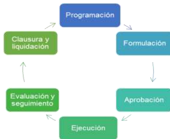
Figura. 1. Proceso del Ciclo Presupuestario.

presupuesto general del Estado es un instrumento financiero y como tal está formado por varias etapas, las mismas que se presentan en la figura 1.