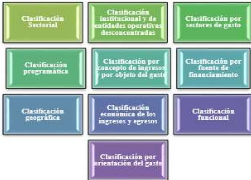
Figura. 2: Clasificación Presupuestaria. Fuente: Ministerio de Finanzas (2019)