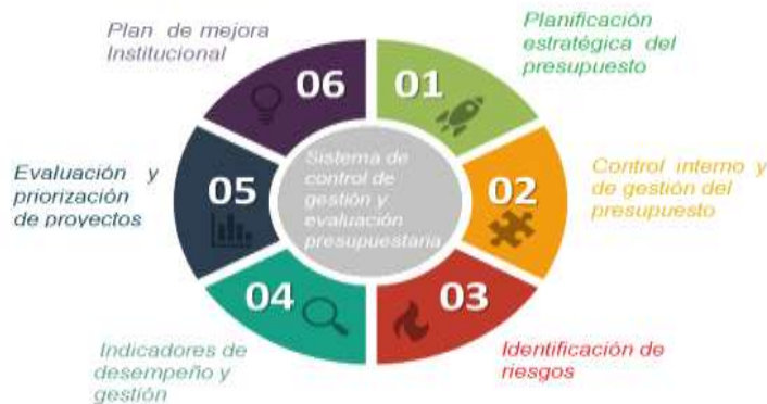
Figura 3. Sistema de control de gestión y evaluación presupuestaria

Cristian Homar Blacio-Aguilar; Cecilia Ivonne Narváez-Zurita; Juan Carlos Erazo-Álvarez