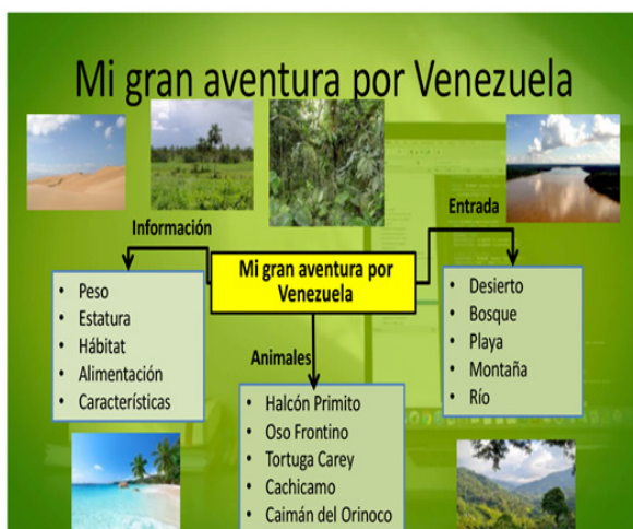
Figura 6: Pantalla componentes del videojuego “Mi gran aventura por Venezuela”.