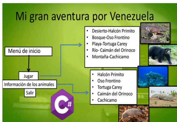
Figura 5: Pantalla estructura del videojuego “Mi gran aventura por Venezuela”.

En la primera versión del videojuego, y tomando en cuenta lo señalado por Rodríguez y Rojas-Suárez (2015), se han incorporado los siguientes animales en extinción: halcón primito (desierto), oso frontino (bosque), tortuga carey (playa), caimán del Orinoco (río) y cachicamo (montaña), los cuales, según este mismo autor, son animales que están “en peligro de extinción por acción de la cacería y por la pérdida de hábitat” (p.103).