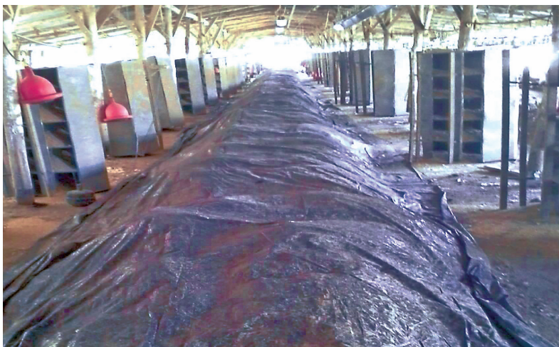
Figura 2. Tapado de la gallinaza acordonada.

La gallinaza puede ser transportada a una bodega para almacenamiento (no es un procesador, sino un intermediario) o directamente a la finca en donde la van a utilizar. En las bodegas del intermediario la gallinaza se almacena con buena ventilación y alta rotación a través de movilización de sacos de un lado a otro para reducir riesgos de incendio, ya que, por la actividad microbiológica, es un producto inflamable.