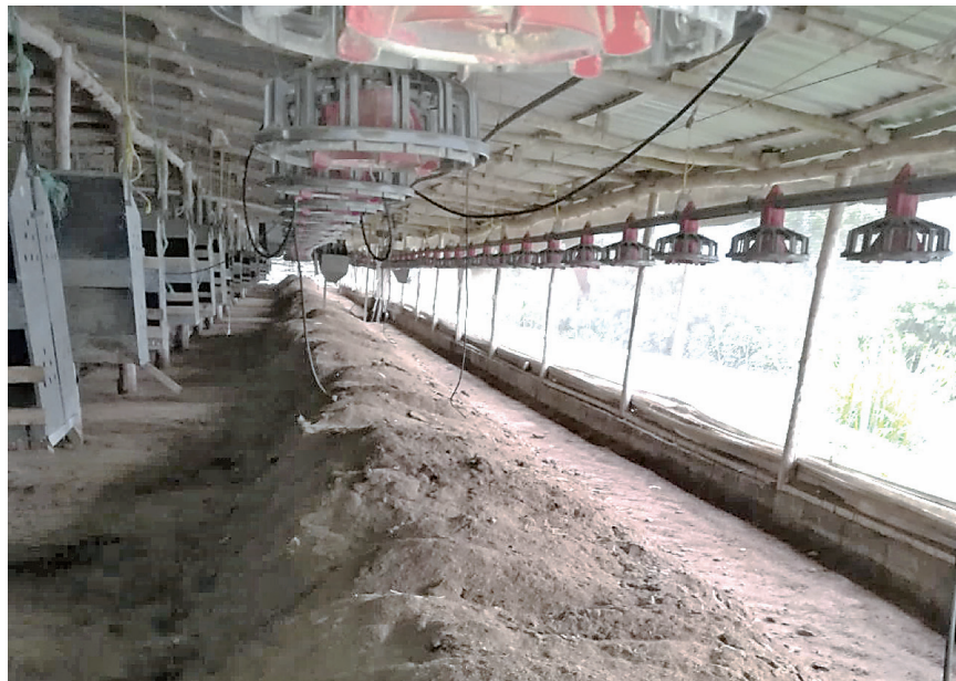
Figura 1. Acordonado de la gallinaza a lo largo de la galera.

Primeramente, se acordona la gallinaza a lo largo de las galeras, como se observa en la figura 1 y luego se procede a taparla con plástico según la figura 2 por un tiempo de tres a cinco días, periodo en donde se mantiene monitoreo de la temperatura. Con este sistema se alcanzan valores entre 55°C y 60°C, los cuales están dentro de lo permitido en el Reglamento indicado para este procedimiento.