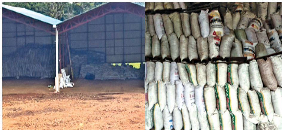
Figura 3. Gallinaza almacenada por un “procesador” en Sabanilla de Alajuela. Izquierda: Bodega, derecha: Forma de estibar los sacos con gallinaza.

La figura 3 muestra una bodega donde se almacena gallinaza y en ella se dan los manejos citados.