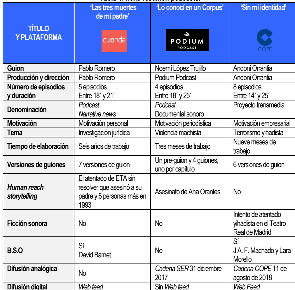
Tabla 1: ficha resumen podcasts .