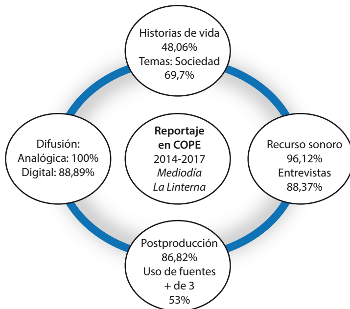
Gráfico 1: el reportaje en COPE, 2014-2017, La Linterna y Mediodía .