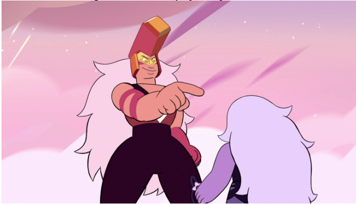
Imagen 7. Los cuarzos Jasper y Amethyst se enfrentan.