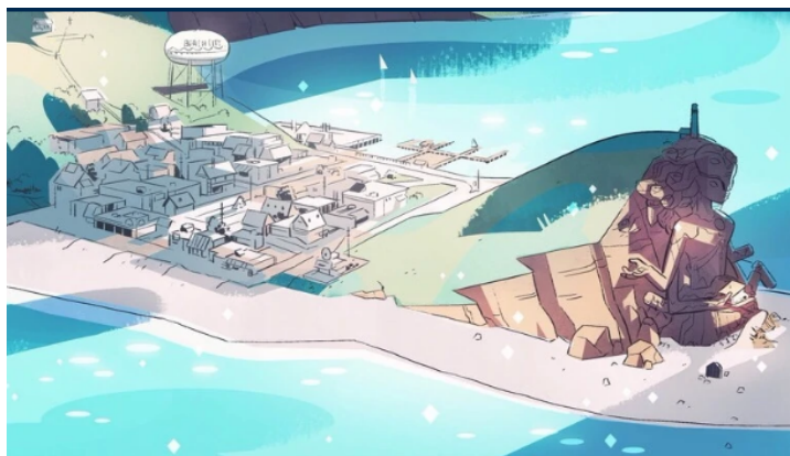
Imagen 1. Beach City.

Fuente: Steven Universe (imagen recurrente).