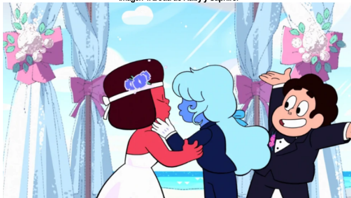
Imagen 4. Boda de Ruby y Sapphire.