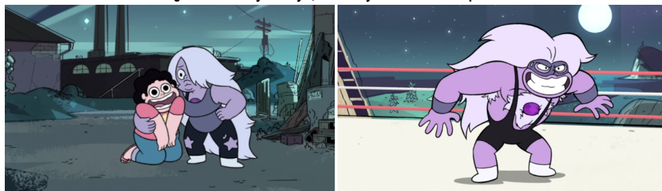
Imagen 6. 6.1 Steven y Amethyst; 6.2 Amethyst convertida en Purple Puma.