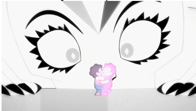
Imagen 9. Abrazo de aceptación de Steven.