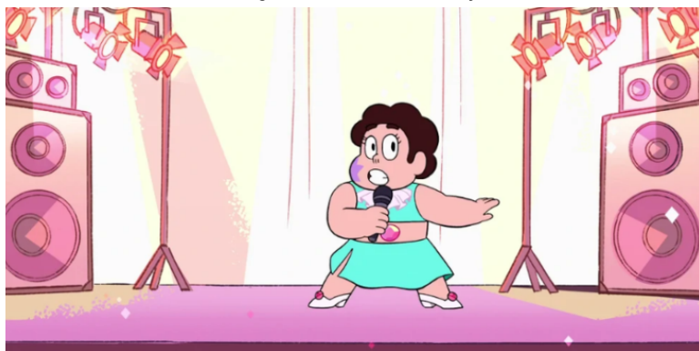
Imagen 2. Steven actúa en Beach City.