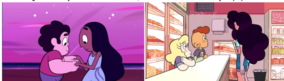
Imagen 5. 5.1 Steven y Connie bailan antes de la fusión; 5.2 Stevonnie se encuentra con Sadie y Lars por primera vez.