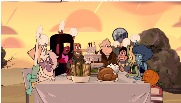
Imagen 8. Acción de Gracias en familia.