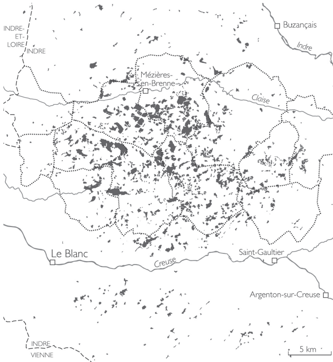
Figure 3: Une constellation d'étangs