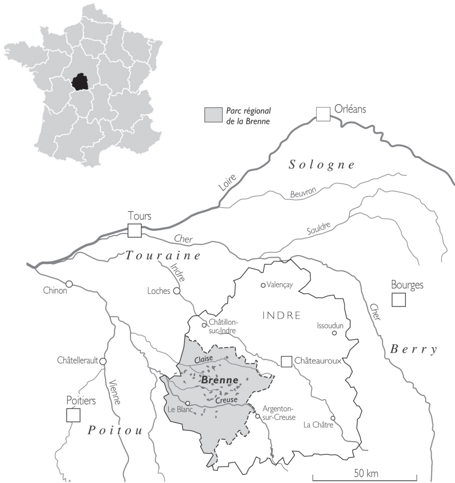
Figure 1: La Brenne, au coeur de la France