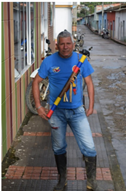
Figura 1. Guardia campesino, municipio de San Calixto, 2018.