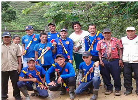
Figura 5. Recorrido entre campesinos e indígenas para identificar sitios de importancia Barí en el polígono sur de la propuesta de ZRC, 2018.

La Guardia se mueve a través de la autogestión con eventos para generar recursos y que hacen muchas veces los mismos guardias para comprar su camiseta, bolillo o asistir a los cursos de formación (Abril, 2018).