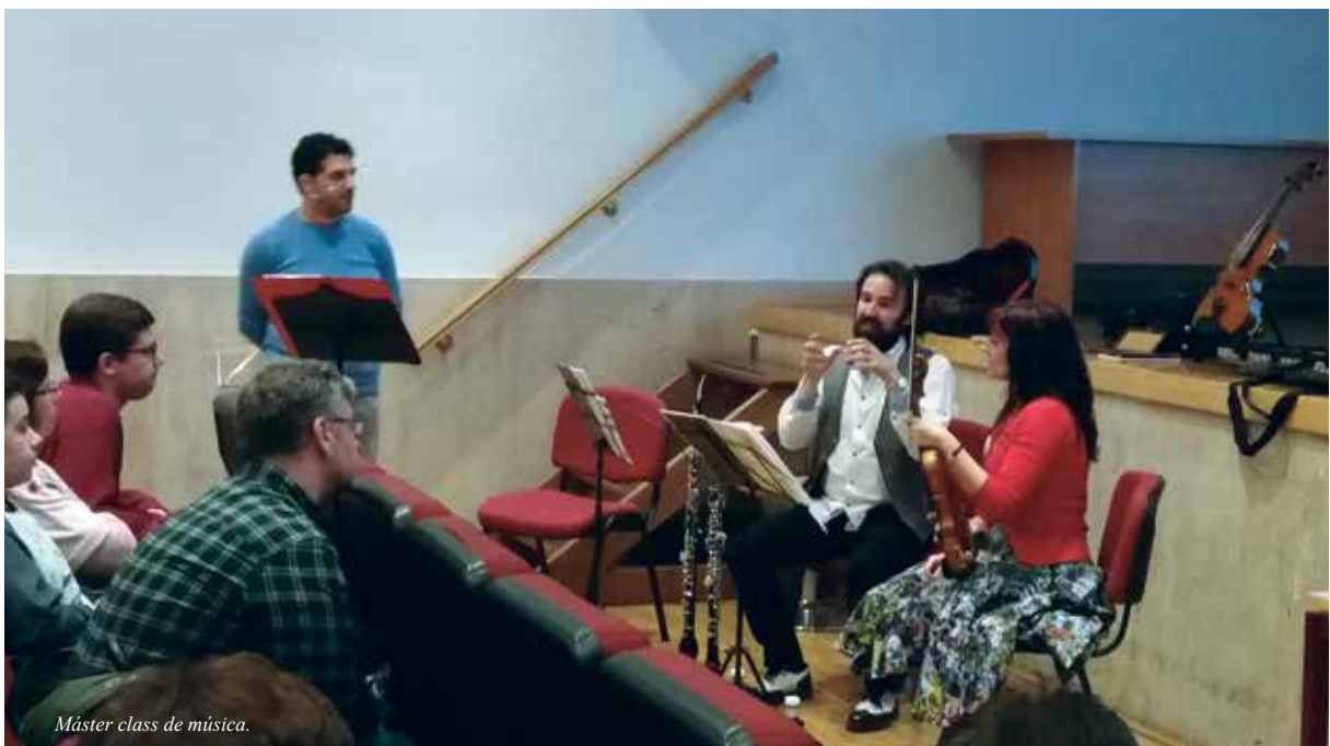
Máster class de música.

Igualmente desde 2004, los ciudadanos de Talavera pueden formarse en las por entonces llamadas “nuevas tecnologías” porque la BPM José Hierro dispone de un centro de internet con 45 puestos con ordenadores, aportado por la Junta de Castilla La Mancha, en el que se imparten por el personal bibliotecarios y con profesores enviados también por la Junta, cursos de acceso a internet y otros para