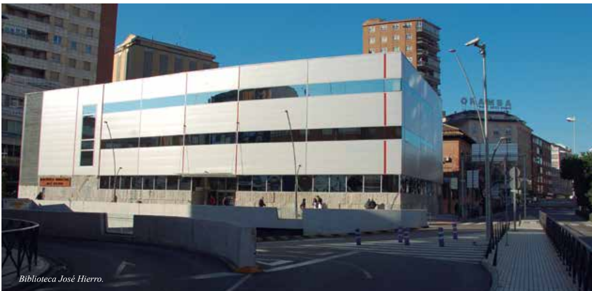
Biblioteca José Hierro.

Durante el curso 2019-20 las bibliotecas de Talavera ofertan 38 clubes de lectura, coordinados por las bibliotecarias y en algunos