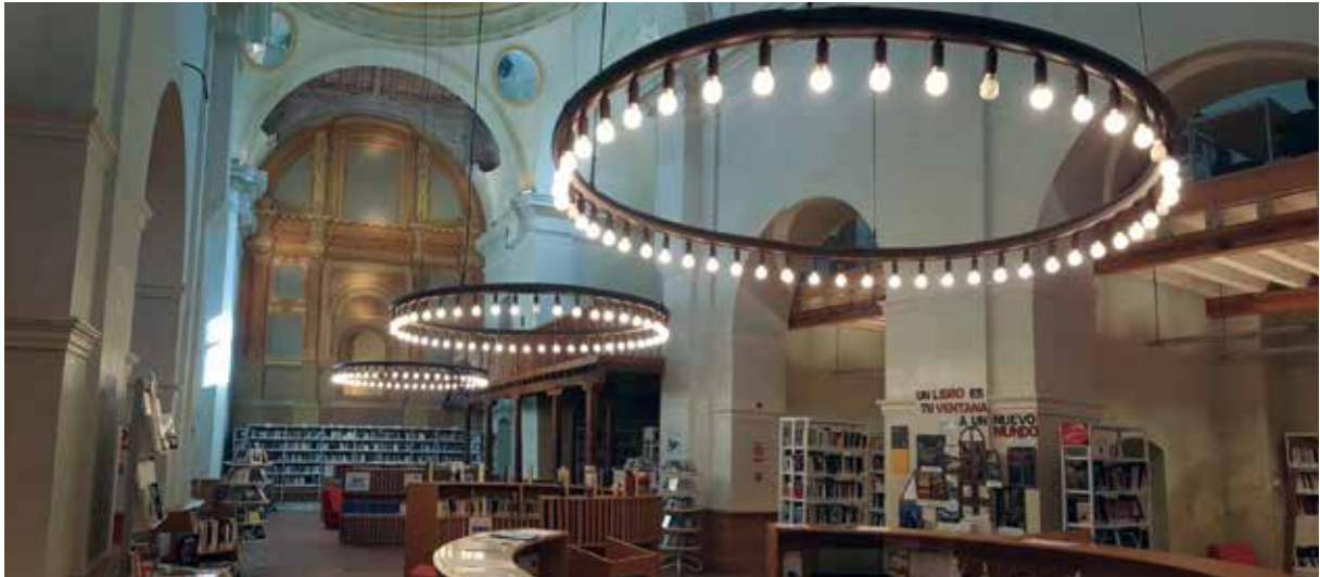
Niveiro Alfar El Carmen.

casos con la participación de monitores sobre temática variada. Consideramos que es el mejor ejemplo de nuestra labor de fomento de la lectura: estos usuarios leen durante el curso una media de cuatro o cinco libros y se reúnen semanal o quincenalmente en nuestras instalaciones con la ilusión de compartir puntos de vista y opiniones, en algunos casos no coincidentes, pero todas muy respetables. Con los clubes de lectura la biblioteca se convierte en un centro de formación ciudadana, libertad y respeto. A esta oferta se suman los talleres de autoayuda, costura, conversación en francés e inglés, memoria y alfabetización, por lo que las bibliotecas de octubre a mayo están repletas de vida y cultura, además de constituirse como un punto de encuentro social de acceso rápido y cercano a