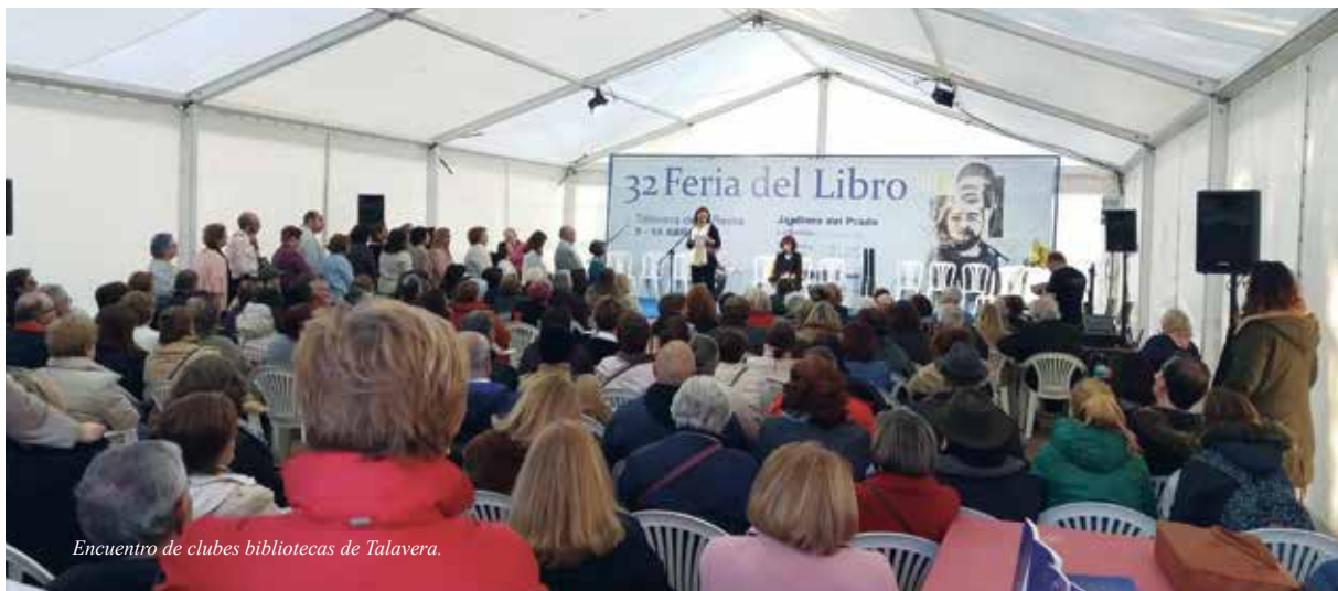
Encuentro de clubes bibliotecas de Talavera.

No puedo dejar de mencionar la colaboración con la Facultad de Educación Social de la Universidad de Castilla La Mancha que desde su implantación en nuestra ciudad ha considerado nuestras bibliotecas como un buen centro de prácticas para sus alumnos. Lo que viene a demostrar que las bibliotecas del siglo XXI, no son únicamente un espacio de trabajo bibliotecario sino que también tiene cabida en