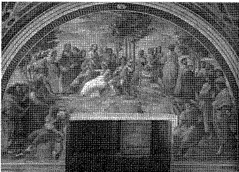
Rafael Sanzio. O Parnaso . 1509-1510.