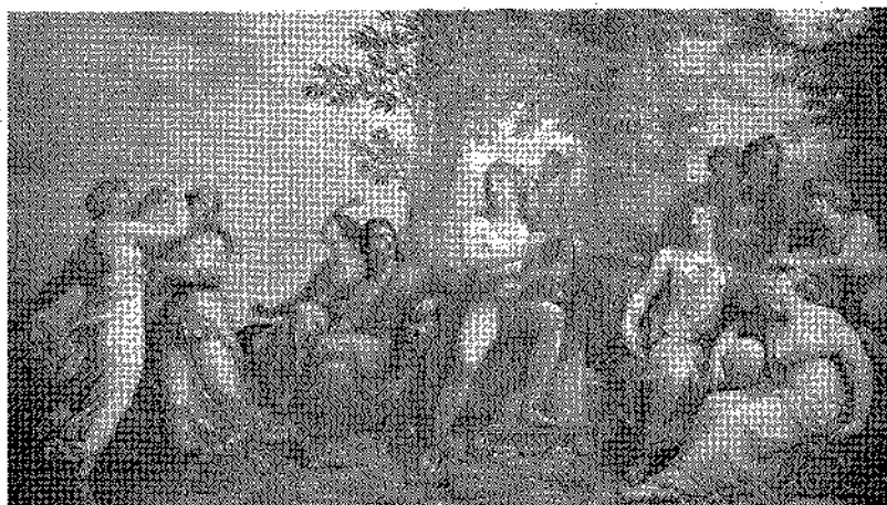
Andréa Appiani. O Parnaso . s/d.

O estilo neoclássico teve grande repercussão na Europa e seu maior representante foi o pintor Jaques Louis David (1748-1825), que atingiu o apogeu com sua obra O Juramento aos Horácios , em 1784. No Brasil, esta corrente artística frutificou após a vinda da Missão Artística Francesa, em 1816, com a proposta de dedicar-se especialmente à especialidade histórica,