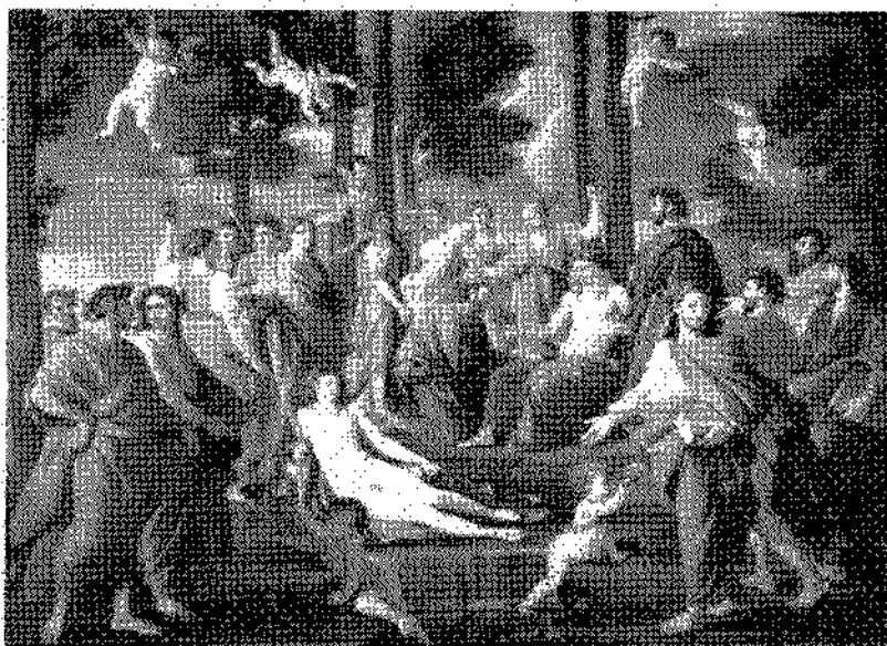
Nicolas Poussin. O Parnaso. s/d.