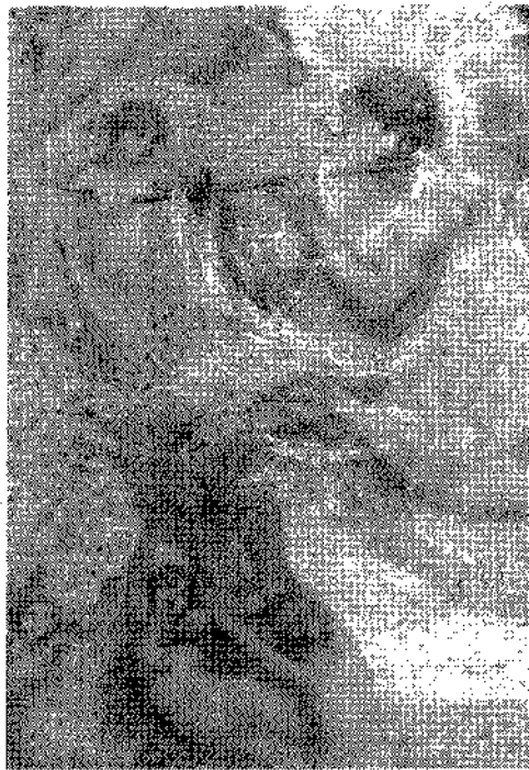
Eliseu Visconti. Apolo. (Detalhe do painel Alegoria à música ). 1913-1916.