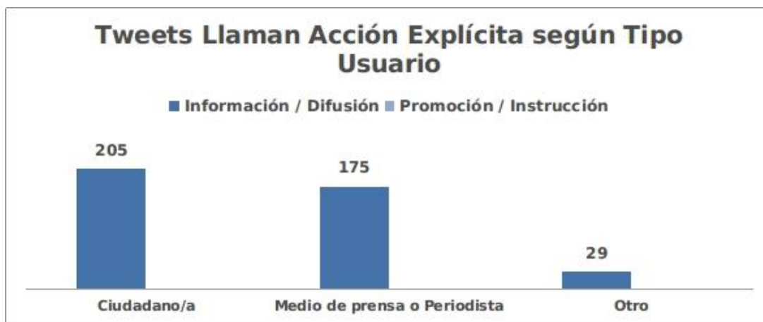
(Figura 3: Tweets según tipología de mensajes y tipo de cuenta. Elaboración propia).

Asumiendo las limitaciones de la muestra, el 100% del total de los tweets (n=409) analizados corresponden a difusión de distintos tipos de informaciones, es decir, ninguno de ellos contiene llamados explícitos a la movilización política. Ello puede deberse a que la muestra fue constituida en base a palabras clave, donde no necesariamente coincidieron los tweets que contenían llamados explícitos a la movilización. También debe tenerse en cuenta que el scraper web sólo permite extraer tweets de carácter público, siendo probable que aquellos que contenían llamados a la acción, fueron twitteados con restricciones de privacidad.