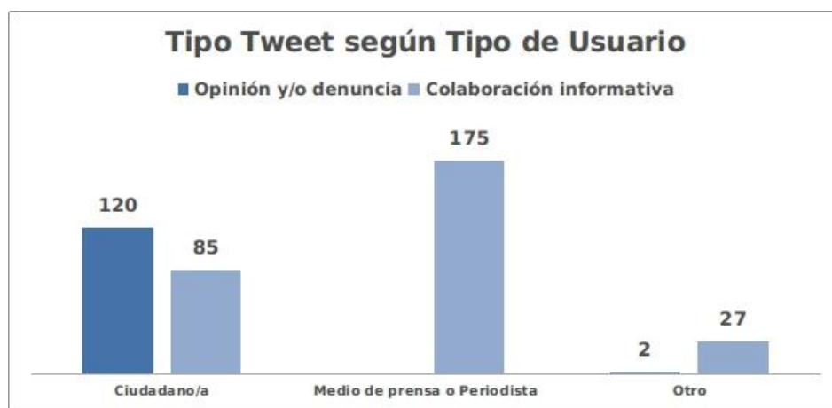
(Figura 2: Tweets según tipología usuarios y tipo de cuenta. Elaboración propia).

acontecimientos en que el emisor ha tenido directa participación. Estas no se realizan, según los autores, siguiendo valores periodísticos en la publicación de contenidos. Constituyen el 30% (n=122/409) del total de tweets de estudio, y fueron publicados en un 98% (n=120/122) por cuentas de ciudadanos/as. El 66% (n=80/122) de ellas contienen interpelaciones directas al gobierno, medios de prensa, y empresas asociadas a la industria salmonera, por protagonizar y/o encubrir acontecimientos vinculados a la supuesta marea roja. La distribución se ilustra en la Figura 2.