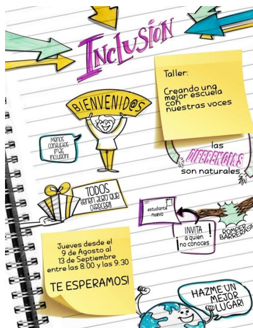
Figura 1: Flyer convocatoria

El inicio de todos los proyectos tiene como gran hito la realización de una convocatoria abierta a todas y todos los/as miembros/as del colectivo con el cual se trabaja, en nuestro caso destaca el estudiantado. Esta actividad se caracteriza por ser voluntaria, otorgando la mayor cantidad de información posible y acompañada de la elaboración de un material visual que acompañe al llamado (figura 1).