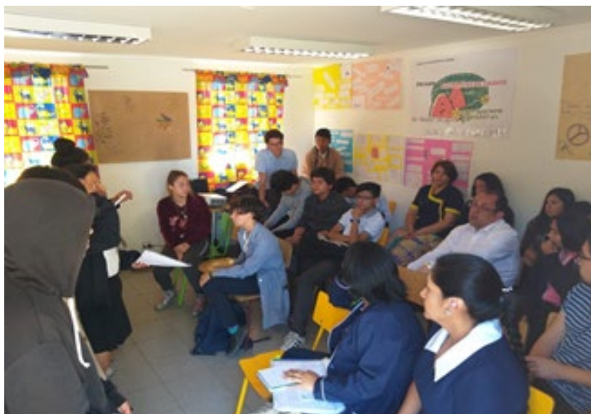
Figura 4: Diálogos participativos

Finalmente, los proyectos desembocan en la co-construcción de un espacio en el cual el colectivo de estudiantes-investigadores pueda debatir y compartir sus ideas con profesores, funcionarios, padres y apoderados, y directivos (figura 4). Ello es fundamental para el desarrollo de una cultura abierta a la multiplicidad de voces que cohabitan el contexto educativo. Aquí, el estudiantado presenta los resultados de sus exploraciones y se discute en torno a ellos facilitando la negociación de significados y perspectivas sobre la escuela, evitando en todo momento las interpretaciones arbitrarias y convenientes a algún plan previamente orquestado por los adultos, incluyéndonos en nuestra condición de investigadores. De esta forma, el abordaje orienta hacia una indagación conjunta de las culturas estudiantiles, propiciando escenarios para la validación de dicho proceso de producción de conocimiento.