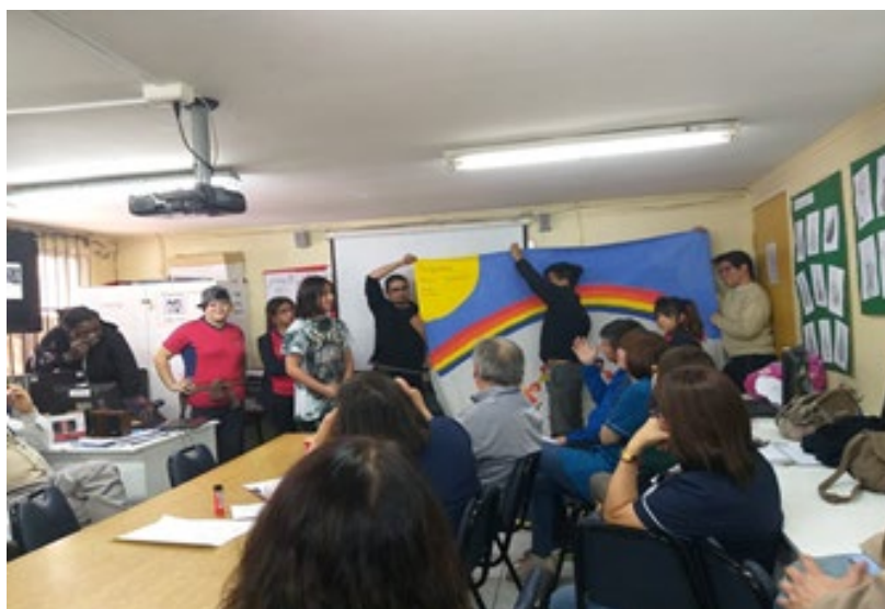
Figura 2: Lienzo “La escuela pequeña pero grande”

Por otro lado, los análisis consisten en categorías que emergen desde el colectivo y que son plasmadas en producciones de diversos tipos y con referencias a sus propias formas de construir sus mundos de vida. A modo de ejemplo, podemos exponer la creación de un lienzo realizado en una escuela (figura 2) con la consigna “La escuela pequeña pero grande” que representa la limitación física de la escuela, pero su potencialidad en cuanto a proyecto educativo; y la producción de dos infografías (figura 3), a partir de la metodología de “Fotovoz”, centradas en develar la necesidad de tranquilidad y diversión que perciben los/as estudiantes en un contexto de alta vulnerabilidad social (Yáñez-Urbina et al., 2018).