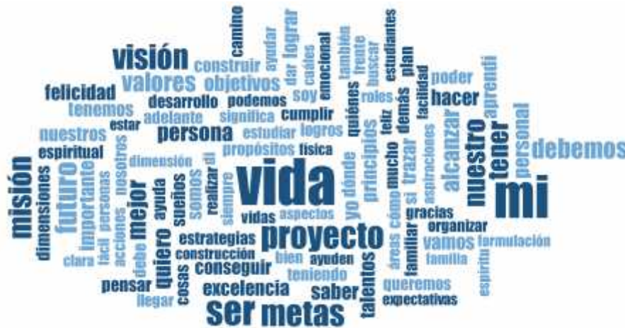
Figura 6. Nube de palabras en aprendizajes sobre Proyecto de vida. Elaboración propia con programa MAXQDA.

creativas. Lo anterior supone el involucramiento sinérgico de cada una de las áreas de nuestro ser (físico, mental, familiar, emocional, espiritual, profesional, entre otras). "Definí mi misión, visión, valores".