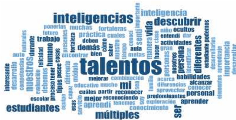
Figura 3. Nube de palabras sobre aprendizajes de talentos e inteligencias múltiples. Elaboración propia con programa MAXQDA.