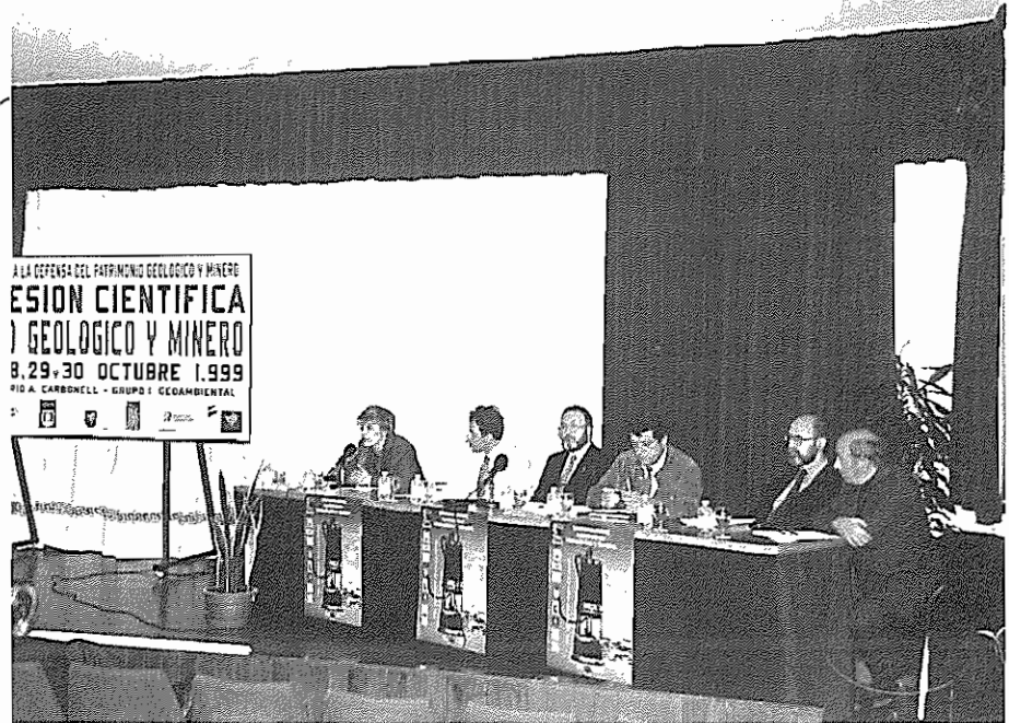
IV Sesión Científica de la SEDPGYM. "Simposio sobre el Patrimonio Geológico y Minero" EUP de Belmez, Universidad de Córdoba, 1999.