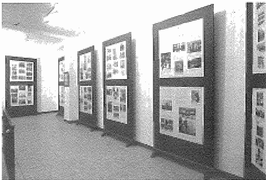
Sala de paneles sobre la presidencia de la república.

acoge. Valga el ejemplo de los Museos Arqueológicos: suelen ser éstos los grandes conocedores de a pié del terreno que ocupan los municipios, es por ello por lo que deben ser referentes obligados en la redacción de cualquier proyecto que afecte al dinamismo territorial de la zona, debiendo informar y suscitar la duda razonable a la par que la proposición de posibles soluciones a los problemas planteados. En otros casos los Museos de identidad, ya sean de tipo cultural o etnográfico deben siempre de estar atentos, porque éstos son los grandes recogedores de materiales y documentos de épocas que en muchos casos pasan de forma muy rápida sin dar tiempo apenas para una reacción adecuada. Éstas y otras muchas cuestiones