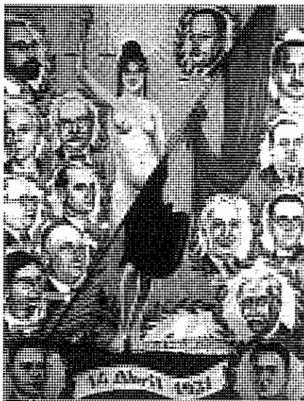
Alegoría de la Segunda República Española.