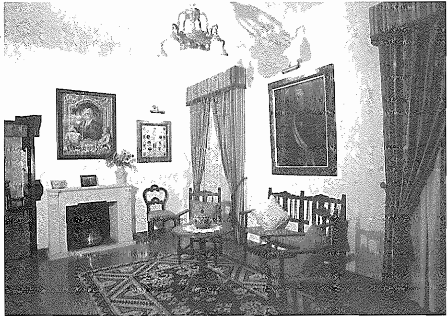
Salón Casa Museo Niceto Alcalá-Zamora. Galería de retratos presidenciales.

profetas de esta idea, como el ministro republicano Filberto Villalobos, que firmó el documento que encabeza nuestras palabras, aplaudirían gozosos el estado actual de la cuestión museológica y de sus propuestas museográficas, que han llenado de viento fresco muchos lugares antes sombríos y polvorientos.