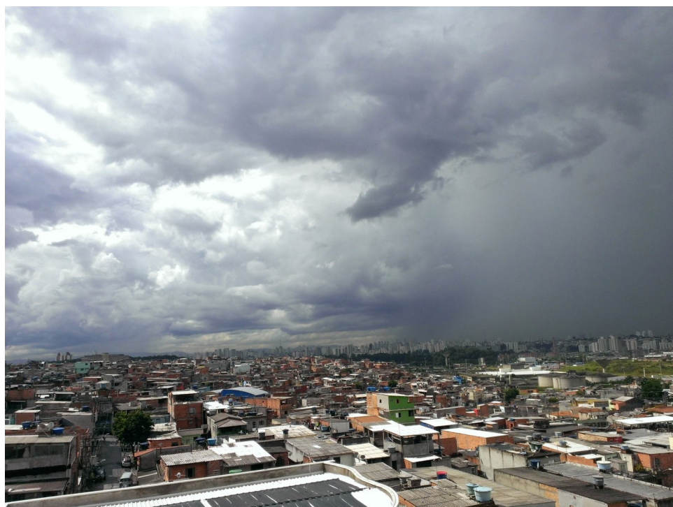
Imagem 5 – Vista parcial de Heliópolis

Essa expansão talvez se deva à mesma combinação de causas que intensifica a pulverização dos “centrinhos” comerciais da região. Não é preciso sair do Heliópolis para conseguir tudo o que é preciso no dia a dia. A “quebrada” tem até farmácia 24 horas agora. “Abriram uma Marisa esses dias lá, guerreiro”, explica um morador bastante otimista, tomando uma cerveja “de remédio”, para relaxar. “E veja só”, fala outro ainda, “tem um Bradesco bem em frente à favela... e não é viagem”, parafraseando um trecho da música Da ponte pra cá , dos Racionais MC’s (2002). Tem mais uma favela também: invadiram a Cocolândia, que era “um pico da hora pra empinar pipa, e virou mó quebrada nervosa”. Do outro lado, no Heliópolis, não sobrou nenhum campo de futebol, tudo virou casa: “mas o que é mais umas casas pra uma favela de 110.000 nêgo?”, tranquiliza-nos um habilidoso jogador de várzea, que agora treina no campão da Vila Arapuá.