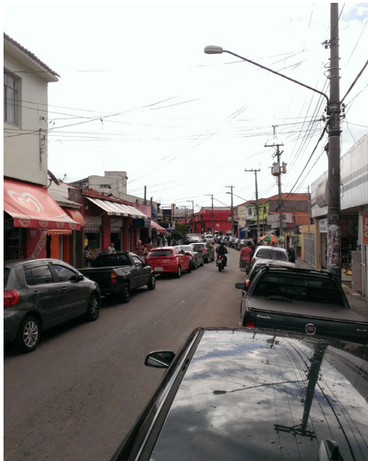
Imagem 4 – Comércio de São João Clímaco

Noite quente nos mesmos arredores. Mais ou menos 23h22. Está tudo mudado. Tem muito mais gente. Tem muito mais grana também. Claro que ainda tem muita gente na “precisão”, no “veneno”. “Mas porra, olha quanto carro e moto tem na quebrada”, diz um astuto observador. Sabe-se bem como é mais fácil calçar um Nike agora, deixar a casa “equipadona com uma pá” de eletrodomésticos. O “centrinho” comercial de São João Clímaco agora conta com quatro bancos. Há algum tempo, um dos supermercados foi comprado e reformado por uma grande rede do ramo, enquanto o outro “não para de fechar e reabrir o tempo todo, só muda o nome”. Há algum tempo, também, se instalou por ali uma “grande farmácia”, que “fica aberta todos os dias até as dez da noite”. As pequenas lojas de roupa, de calçados, “1 e 99”, casas de construção, lanchonetes e botecos, entre outros segmentos, aproveitam a circulação intensa e o “ímpeto de consumo da classe C” — as frases de impacto dos economistas fornecem chaves explicativas para os comerciantes locais. Não é difícil perceber que a economia local segue expandindo, na mesma intensidade em que aumenta o trânsito e se tornam raras as vagas de estacionamento nas intermediações.