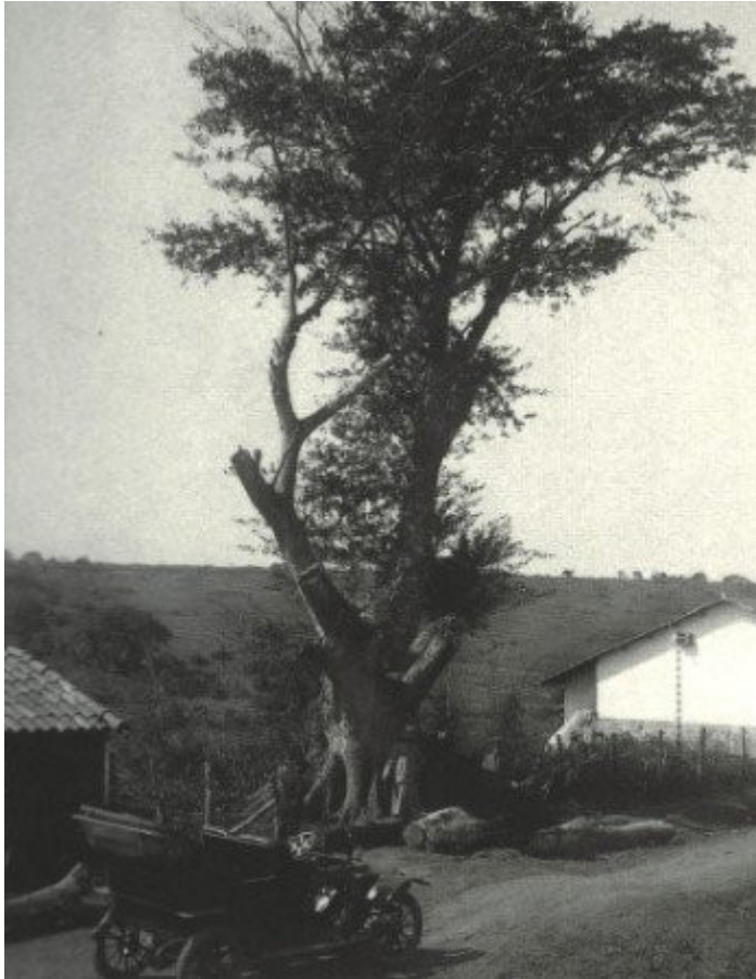
Imagem 1 - Figueira das lágrimas (1910)

Autor não citado. Veja São Paulo , 20/05/2011