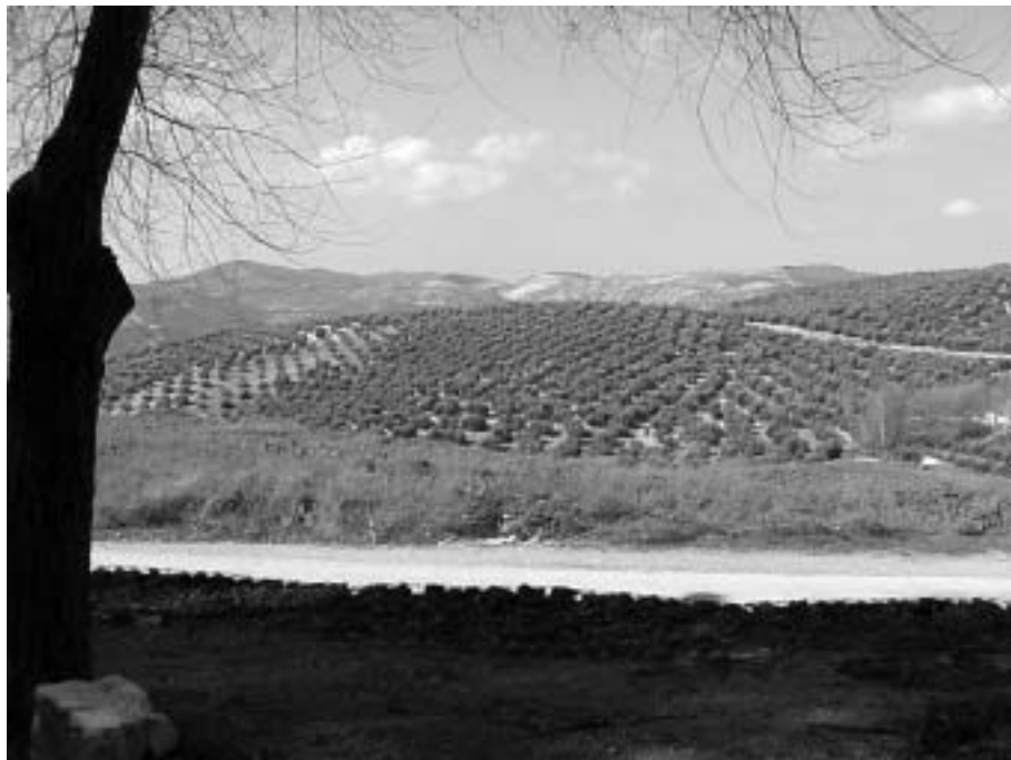
Panorámica del yacimiento de Las Pozas.

que las téseras son unas piezas cuadradas o cúbicas para adornos, embutidos y mosaicos.