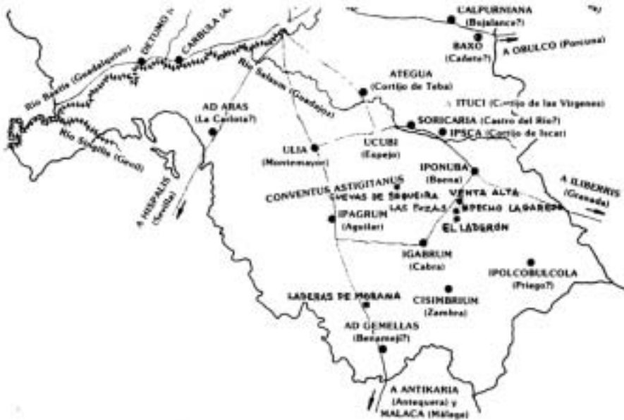
* YACIMIENTOS ARQUEOLÓGICOS DONDE HAN SIDO HALLADAS TÊSERAS

En definitiva, respecto a las téseras expuestas en el presente trabajo, hagan referencia a establecimientos de hostería, baños, etc., lo significativo a destacar es la notable importancia que estos yacimientos arqueológicos del término municipal de Doña Mencía tuvieron en las épocas imperial y tardoimperial, así como también, el destacado grado de desarrollo económico que alcanzaron.