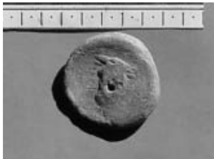
Tésera de El Laderón (Doña Mencía).