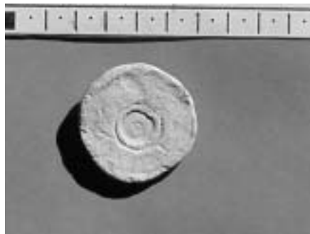
Tésera de Pecho Lagarejo (Baena).

plomo y de forma circular, con un diámetro de 4,8 cms por 0,9 cms de grosor, mostrando la cabeza de Palas Atenea mirando hacia la derecha 3 , y en el reverso se representa a un personaje enfrentado a un animal (¿delfín?), también mirando hacia la derecha. En cuanto a las leyendas, no se han conservado, posiblemente, debido al desgaste o deterioro sufrido por el paso del tiempo.