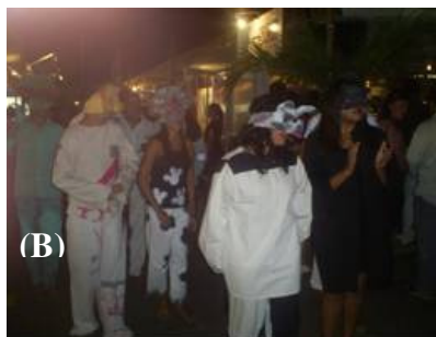
Figura 1- Campanha sobre coleta seletiva: Criança divulgando ato público na comunidade (A) e Peça teatral com a participação da comunidade sobre o tema lixo (B).

O material adquirido na coleta seletiva foi transportado para o galpão da ACREVI, onde foi realizada a triagem do lixo seco, separando os quatro principais componentes dos outros materiais. Neste processo o material foi pesado antes e após a separação do material aproveitado, com as perdas sendo estimadas por diferença dos pesos. Com base nestes dados foi calculado o peso médio dos resíduos sólidos coletados durante cinco dias e o peso dos itens que podem ser diretamente negociados, estimando-se a margem de lucro destes materiais na internet (CEMPRE, 2003).