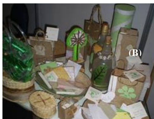
Figura 2- Confecção de vassouras agroecológicas (A) e artesanatos produzidos pela ACREVI (B)