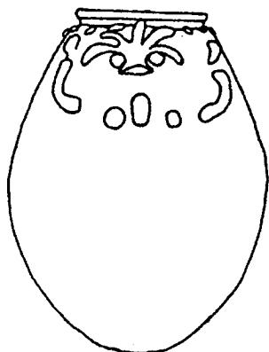
Fig. 9 Vaso con representación de Bes de procedencia desconocida. Guidotti 1983: 41 fig. 3 (tipo A). Tercer Período Intermedio.