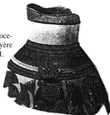
Fig. 8 Vaso con dibujos de Bes procedente de Amarna. Peet y Woolley 1923 lám. XLV, fig. 4. Dinastía XVIII.