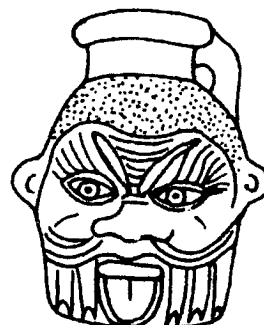
Fig. 12 Vaso plástico de Bes procedente de El Fayum. Guidotti 1983:57 fig. 84 (tipo C). Período Grecorromano.