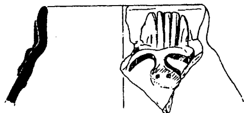
Fig. 11 Vaso con representación de Bes procedente de Enashia el-Medina. López Grande et alii 1995:60. Tercer Período Intermedio.