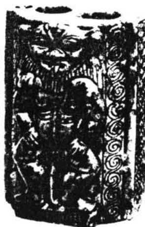
Fig. 5 Contenedor de cohol, procedencia desconocida. Col. Carnavon. Hayes 1959: 192, fig. 107. Dinastía XVIII.