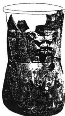
Fig. 7 Vaso con cabeza de Bes procedente de Deir el-Medina. Bruyère 1939:102, fig. 35. Dinastía XVIII.