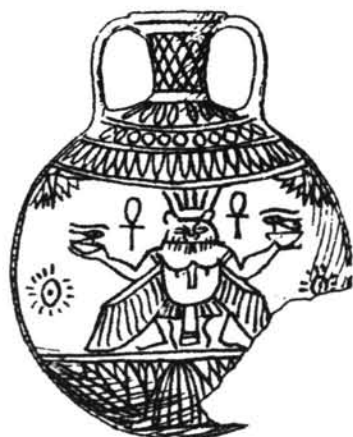
Fig. 4 Vaso procedente de Gurob. Oxford, Ashmolean Museum, 1890.897. Petrie 1974 (reimp.): lám. XVII, 9. Dinastía XVIII.