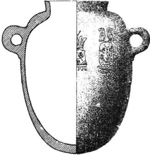
Fig. 1 Dibujo del vaso de alabastro procedente de la tumba nº 17 de la necrópolis del Cerro de San Cristóbal (Almuñécar, Granada). Granada MAP 8332. Pellicer 1963:31 fig. 26,1. Dinastía XXII.