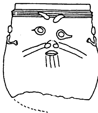
Fig.10 Vaso con representación de Bes procedente de Qurna. Guidotti 1983:46 fig. 7 (tipo B1). Tercer Período Intermedio.