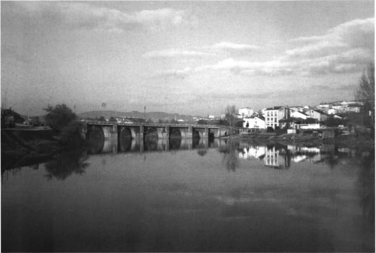
Lámina V. Marcie- Luco Augusti : Puente romano de Lugo.