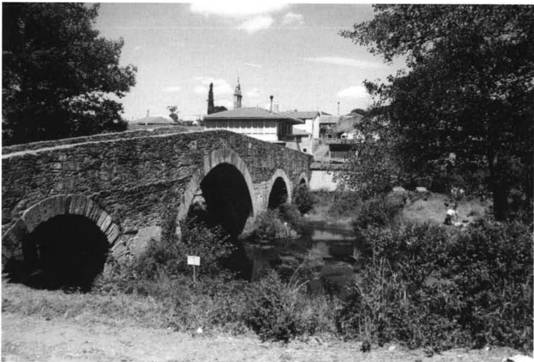
Lámina IV. Brevis - Marcie : Puente viejo de Furelos.