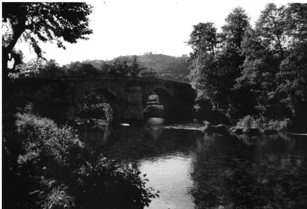
Lámina I. Burbida - Turoqua : Puente de Cernadela. (foto B. Sáez Taboada).