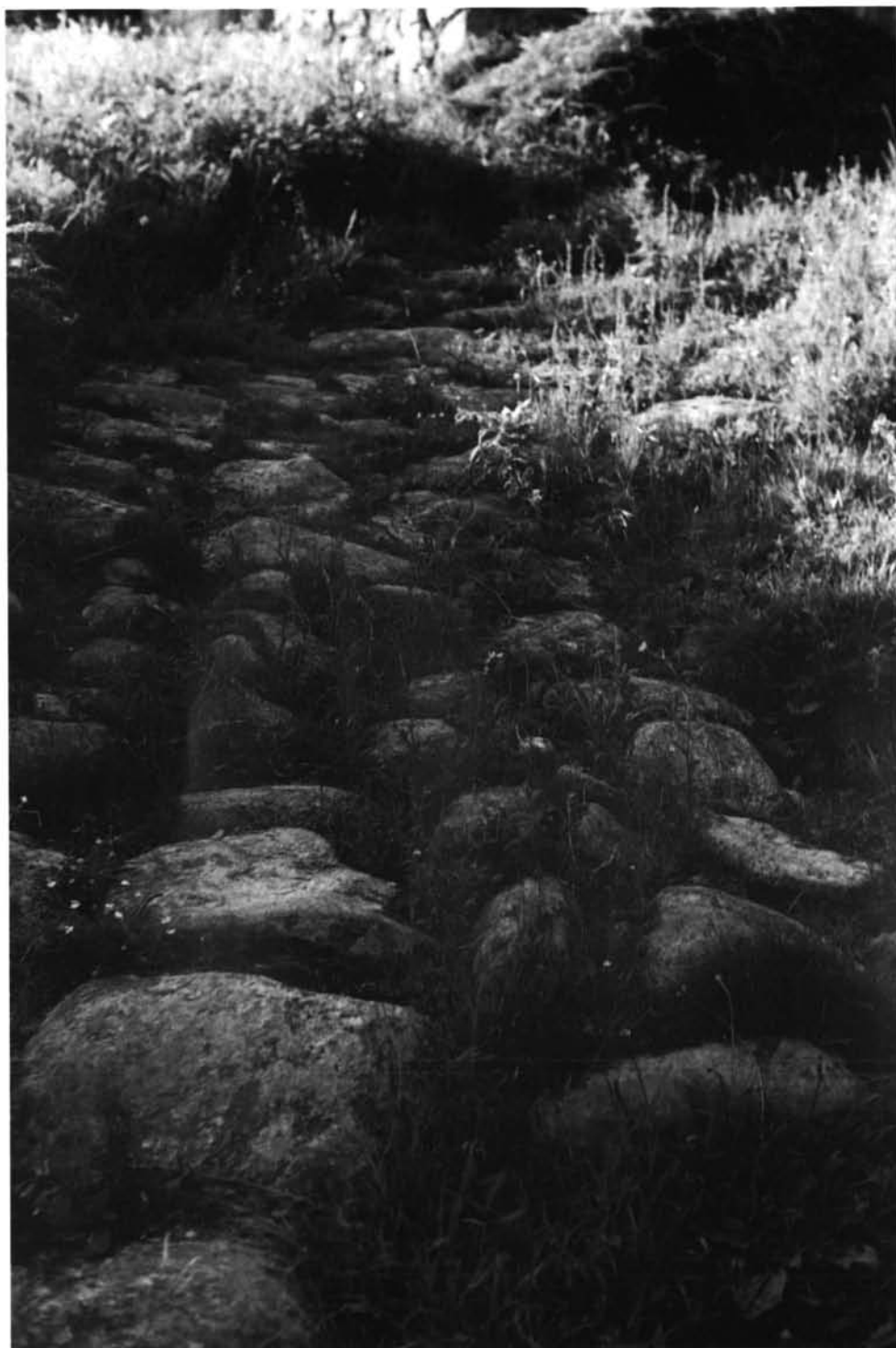
Lámina II. Burbida - Turoqua : Restos de calzada en A Rúa.