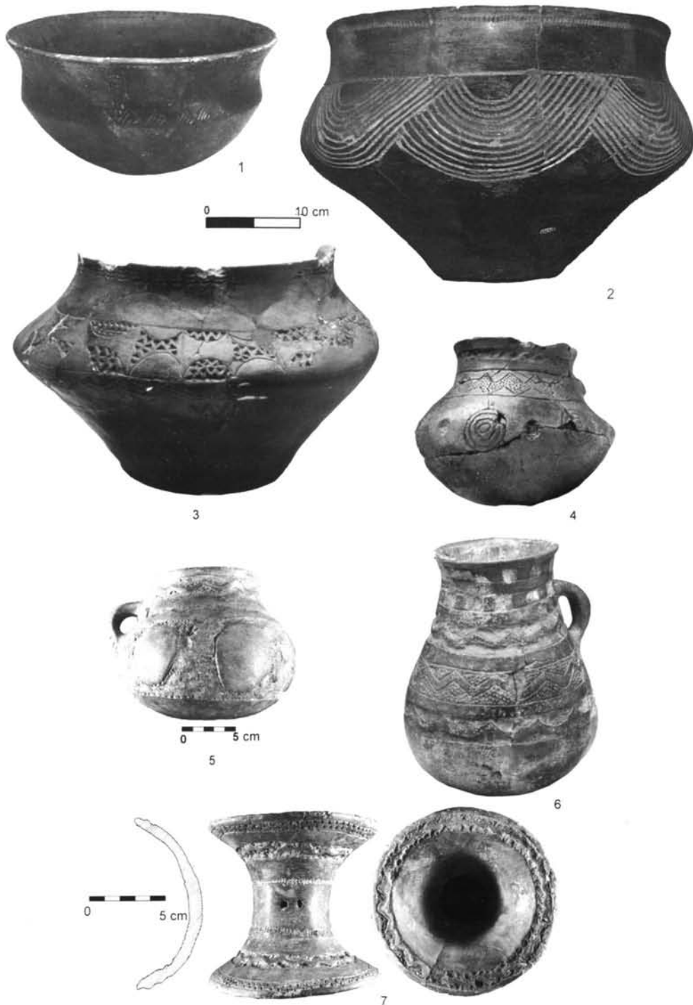
Figura 2: Materiales cerámicos. 1: Protogotas (Arenero de Pedro Jaro II, Museo Municipal de San Isidro de Madrid); 2 a 7: Cogotas I; 2, 5 y 7: Arenero de Valdivia (Colec. Bento MARC); 3 y 6: Arenero de Valdivia (Museo Municipal de San Isidro de Madrid); 4: Arenero de La Fábrica de Ladrillos (Museo Municipal de San Isidro de Madrid).