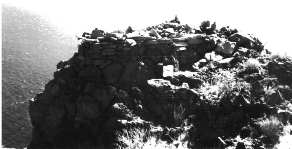
Lámina Ib: Un piro o ara de sacrificio de estructura compleja.