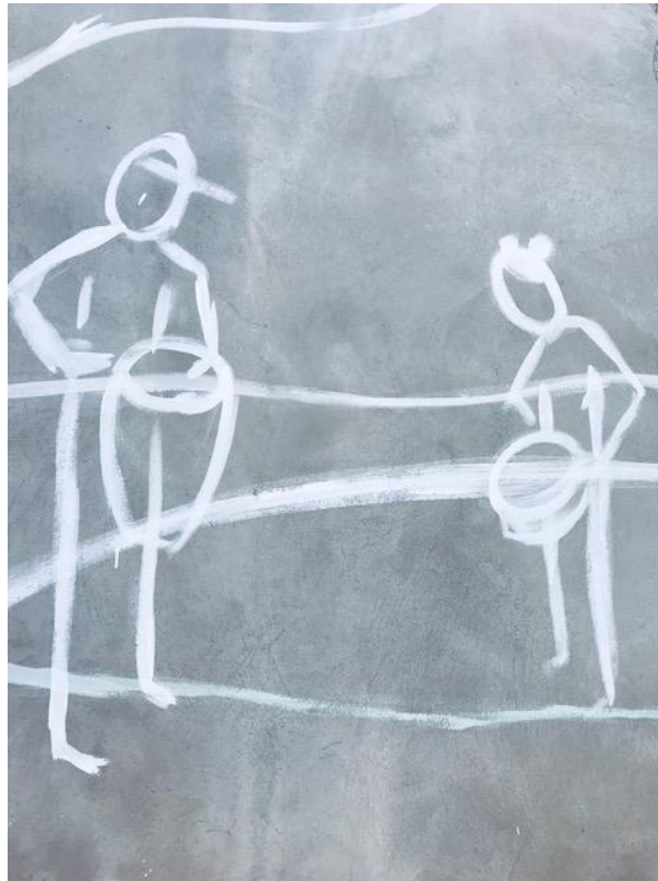
3. Boceto en la pared. La musicalidad colectiva.