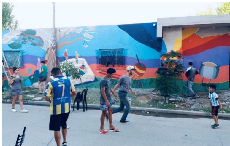
4. Imagen del devenir del evento.