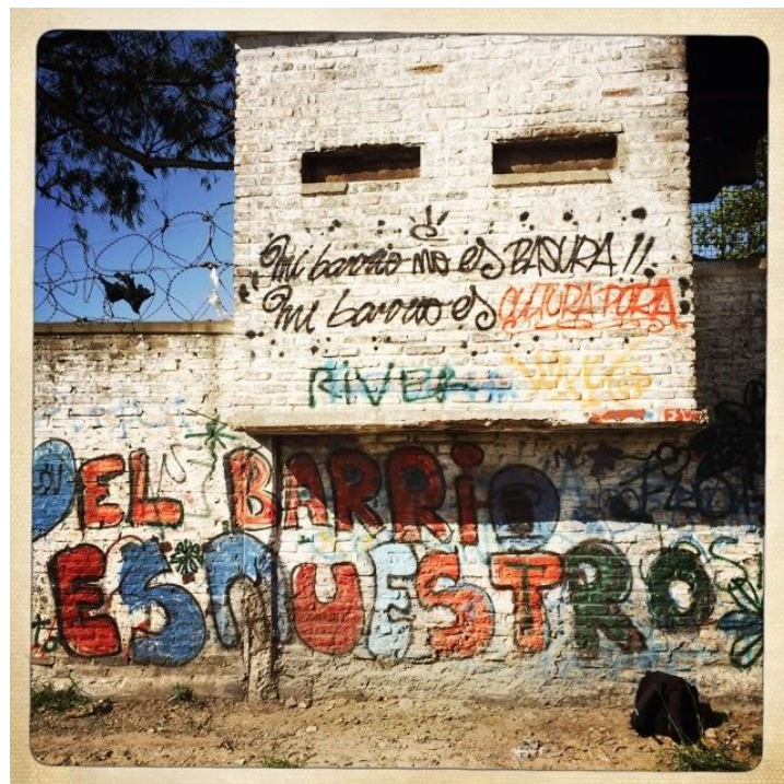
1. Imagen del mural durante la jornada “Mi barrio no es basura”.

Otro de los itinerarios en el marco de la Biblioteca, es el ciclo anual de graffitis «Mi barrio no es basura» que justamente busca visibilizar un reclamo vinculado a la contaminación y violencia ambiental que día a día atraviesan los/as carcomeños/as; así como, las formas complejas de vincularse con la basura, ya que para muchos de ellos es un medio de supervivencia y de trabajo [1] mientras que, para otros, remite a la contaminación y afección corporal que produce. Esta jornada de pintada es colectiva y, previo y durante la pintada, se van conversando aquellas cosas que se quieren hacer (qué pintar, en dónde, con qué colores); todo esto implica una reflexividad que se ejerce en la práctica. En efecto, estas experiencias locales constituyen una «arena» o «arenas culturales», es decir, lugares de confluencia, desmarcamiento y también de diálogo y disputa. Como una suerte de intersticio entre lo que deja huella y lo que se borra.