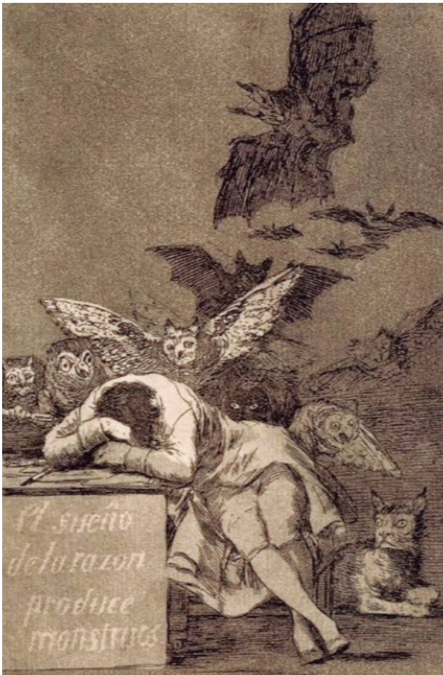
Fuente: El sueño de la razón produce monstruos, Francisco Goya (1797 - 1799).

Por ello la urgencia de un despertar de la razón misma, pero sobre todo, de un despertar de lo sensible, sometido por siglos al imperio verdugo de la razón in-dolente (De Souza Santos, 2003 . Vol 1).