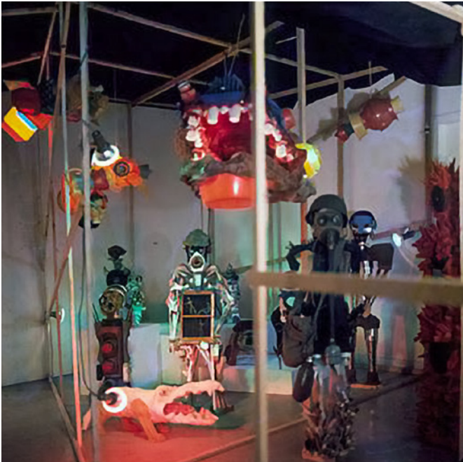
Imagen 2. Antonio Berni, La Masacre de los Inocentes , Museo de Arte Moderno de París. 1971. Instalación.

Si pensamos en la obra de Berni mencionada anteriormente, resulta interesante preguntarnos de qué modo el artista consigue una actualización de este relato bíblico, qué aspectos decide recuperar sobre su tradición visual y qué estrategias utiliza para conseguir una renovación de dicha iconografía.