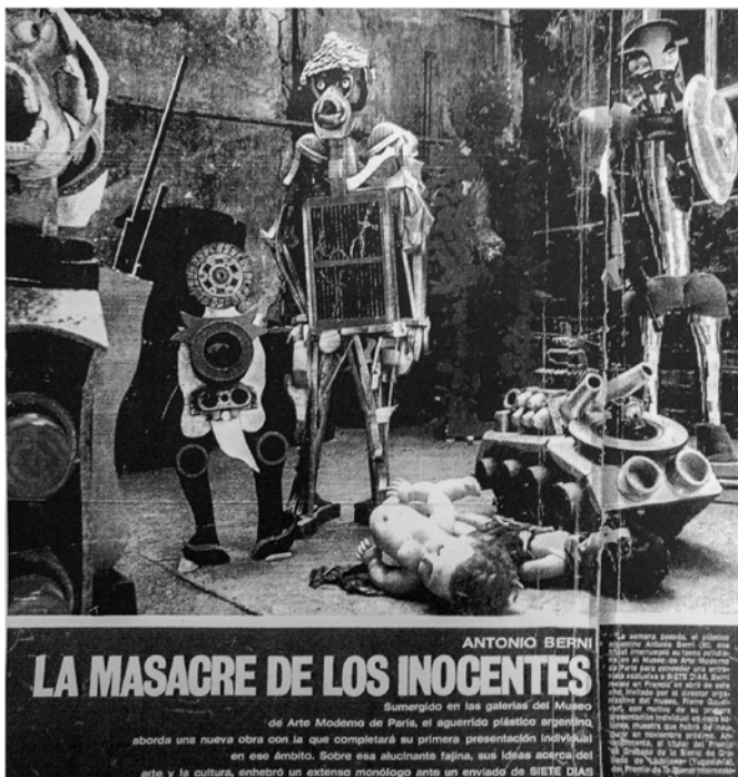
Imagen 3. "Antonio Berni, La Masacre de los Inocentes", Revista Siete Días, Año 5, Nº224, Buenos Aires.