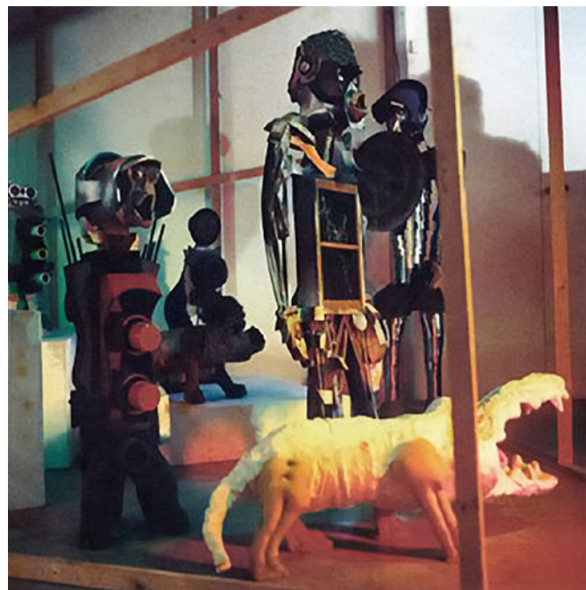
Imagen 1. Antonio Berni, La Masacre de los Inocentes , Museo de Arte Moderno de París. 1971. Instalación.

Ahora bien, en relación con las distintas herramientas discursivas o pictóricas utilizadas a lo largo de la historia para representar masacres, Burucúa señala una dificultad que se advierte en las representaciones del siglo XX. La magnitud de los horrores de la experiencia contemporánea hace que las viejas fórmulas se volvieran inadecuadas, por lo que resultaría necesario explorar en nuevos horizontes formales para poder dar cuenta de los hechos (Burucúa, 2014, p. 179).