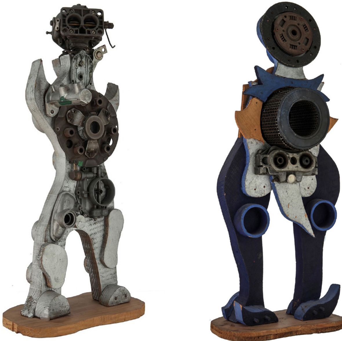
Imagen 5. Antonio Berni, Robot, La Masacre de los Inocentes , Museo Nacional de Bellas Artes, Buenos Aires, 1971. Construcción polimaterial.

válvulas del mecanismo. De esta manera, Berni consigue imprimir el gesto humano sobre el rostro mecanizado.