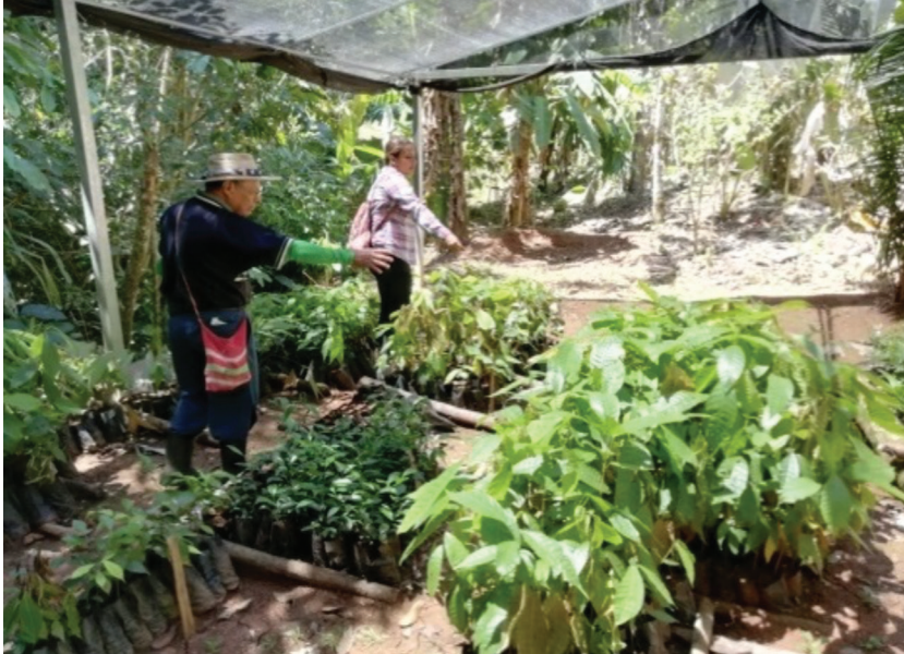
Figura 2. Vivero forestal comunitario, en el territorio indígena de Salitre.

Así, en los sistemas de producción indígena se visualiza la construcción del futuro al poner en práctica las enseñanzas ancestrales e históricas de uso y conservación de los recursos de la naturaleza. Entonces, los bosques atesoran el mundo cosmológico de los habitantes nativos, por ello todo el bosque es la vida de la comunidad indígena, en el sentido espiritual, material y cultural. Esto conlleva a la sostenibilidad de los ecosistemas en el tiempo 22 . Por lo tanto, estos sistemas indígenas se asocian estrechamente a áreas de conservación, reservas de vida silvestre y bosques agrícolas, que buscan mantener el equilibrio ecológico y el bienestar colectivo.