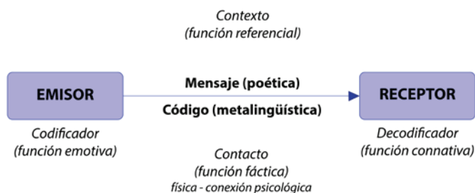
Imagen 1. Las dimensiones del lenguaje. Jakobson (1988).

De otro lado, Álvarez-Gayou (2003) explica diferentes marcos referenciales para poder investigar un fenómeno desde las bases de un paradigma metodológico, y para definir el “interaccionismo simbólico” utiliza los siguientes puntos a tener en cuenta: