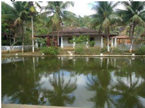
Figura 2 – Casa-Grande do Engenho