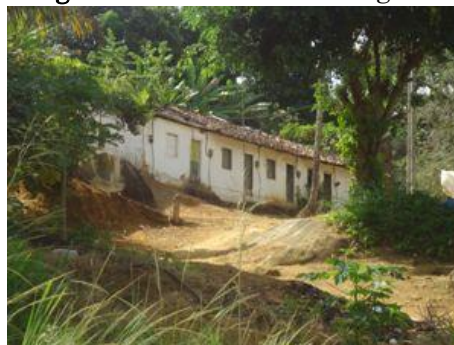
Figura 3 – Arruado do Engenho