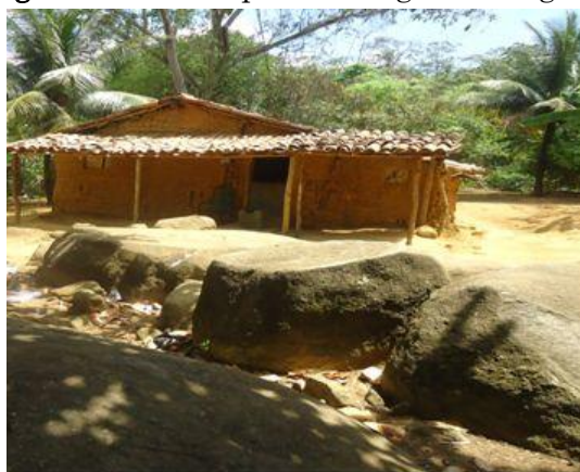
Figura 4 – Casa típica do Engenho Megaípe