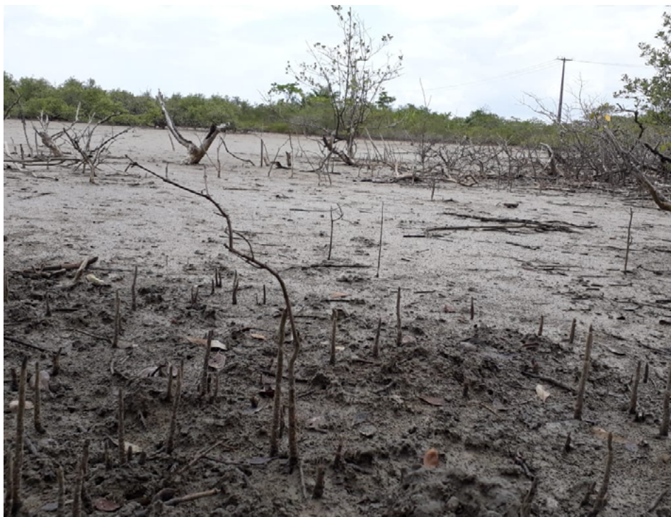
Figura 4: “prainha”: área de manguezal degradada pelo impacto da indústria petrolífera.

Pela presença da cadeia petrolífera nacional, as áreas de manguezal da cidade são ocupadas tanto por novas e desativadas estruturas da Petrobras quanto pela presença do que seus moradores chamam de prainha , áreas abertas de manguezal com a vegetação morta pela contaminação por vazamento de petróleo (Figura 4). As paisagens da prainha da cidade são reconhecidas pela ausência das espécies de árvores de mangue e, portanto, das muitas vidas que ali estão a elas relacionadas. Ou seja, as paisagens arruinadas do manguezal e suas encostas contam a história do petróleo na cidade, justamente quando nela não se encontram mais as espécies de árvores de mangue e a malha de vidas e elas conectadas. Quando o petróleo destrói o mangue, não há caranguejos, aratus, guaiamuns, ostras e sururus. Sem esses, não há a presença dos pescadores artesanais e a malha de vidas que conformam o território pesqueiro. Com o petróleo derramado e vazado, a vida se torna difícil e hostil às espécies que coabitam o mangue, incluindo a população negra de São Francisco do Conde.