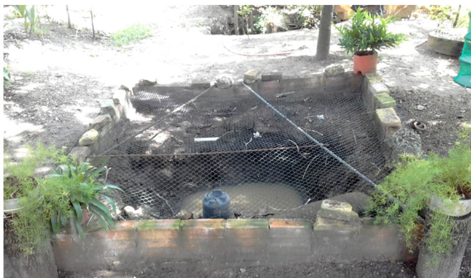
Figura 6: “berçário” de guaiamuns no quilombo Dom João, São Francisco do Conde.