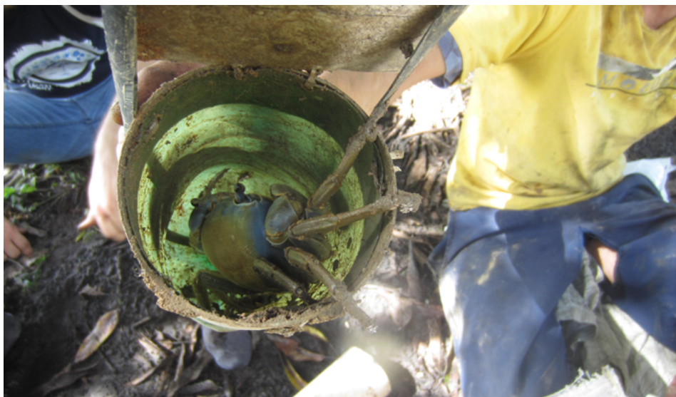
Figura 2: guaiamum capturado numa ratoeira.

de borracha. Quando a isca é colocada e a ratoeira é armada, a tampa fica presa numa posição em que deixa aberta a entrada do cilindro. Essa abertura é disposta na entrada da toca do guaiamum, de modo que quando o animal sai da toca, ele entra na armadilha e tenta puxar a isca. O arame solta então a tira de borracha e provoca o fechamento da ratoeira, aprisionando o guaiamum.