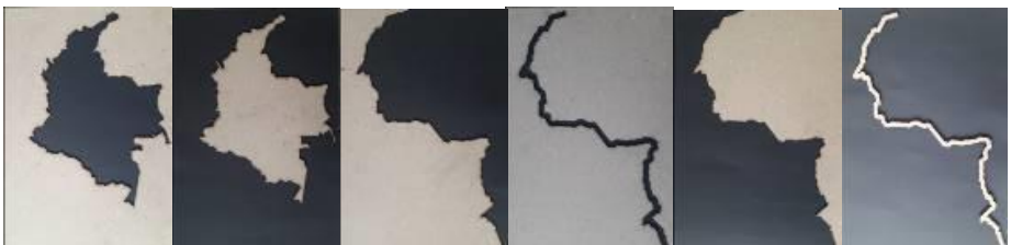
Figura 5. Cortes

El cuarto corte se hizo extrayendo por completo el mapa de Colombia del cartón. Se trabajó, de igual manera, de dos modos, por un lado, el mapa se fijó sobre el centro de una superficie de fondo negro y por otro al cartón con la forma vacía de Colombia se le colocó fondo negro. Ambos casos evidencian el aislamiento de una cosa respecto a la otra, mostrando una relación marginada con el otro (Villafuerte, 2009; Didi-Huberman y Giannari, 2018). En el caso del mapa de Colombia entero colocado sobre el fondo negro, este se comporta como un elemento aislado en un nivel superior y por debajo de ella el resto oscuro. En su inverso, es decir el mapa de Colombia como vacío negro, es Colombia la desconocida y la que tiene una posición inferior. Por tanto, en ambos casos puede comprenderse la marginación de uno respecto al otro como diferencia de estatus o rangos en cualquiera de las dimensiones políticas a tratar (Villafuerte, 2009; Velasco, 2016).