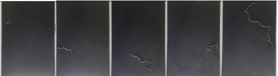
Figura 2. Moldeado con alambre.

2) El moldeado (figura 2) de “Línea-miento de política territorial internacional” es el dibujo de cada uno de los límites con alambre. Tomar la pinza, sujetar el alambre y luego moverlo de acuerdo a lo trazado por la política territorial internacional, es, en síntesis, manipular el alambre mediante un instrumento para configurarlo en torno a lo representado, revela, de esta manera, el manejo entre dos y la negociación política que existe en cada movimiento de esa línea. Una línea limítrofe que se va moldeando entre representantes de dos gobiernos distintos que, están defendiendo intereses propios (Velasco, 2016) sobre un territorio que sólo se reconoce en términos económicos y estratégicos (Konrad, 2015; Velasco, 2016, Campillo, 2015 y 2018) y que se desconoce desde los procesos naturales y culturales que allí se desarrollan. El alambre ajeno y sin ningún tipo de amarre o sujeción al soporte, evidencia el deslinde de las políticas con la naturaleza de ese territorio.