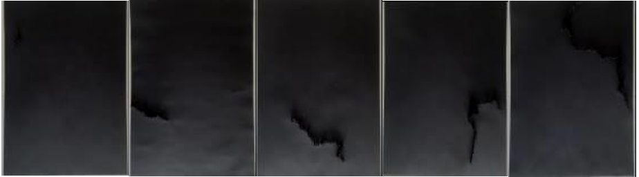
Figura 3. Golpe de martillo.

Es así como puede comprenderse que, la ineficacia de los muros erigidos en las fronteras ha transformado su comprensión de línea administrativa divisoria (borderline) a zona fronteriza (borderland) (Velasco, 2016:86). Se constituye así una expresión de un medio conformado por dos naciones que están, en un caso, "frente a frente" y en el otro, uno marcándole distancia al otro, mediante una amplia brecha que retira el frente del otro.