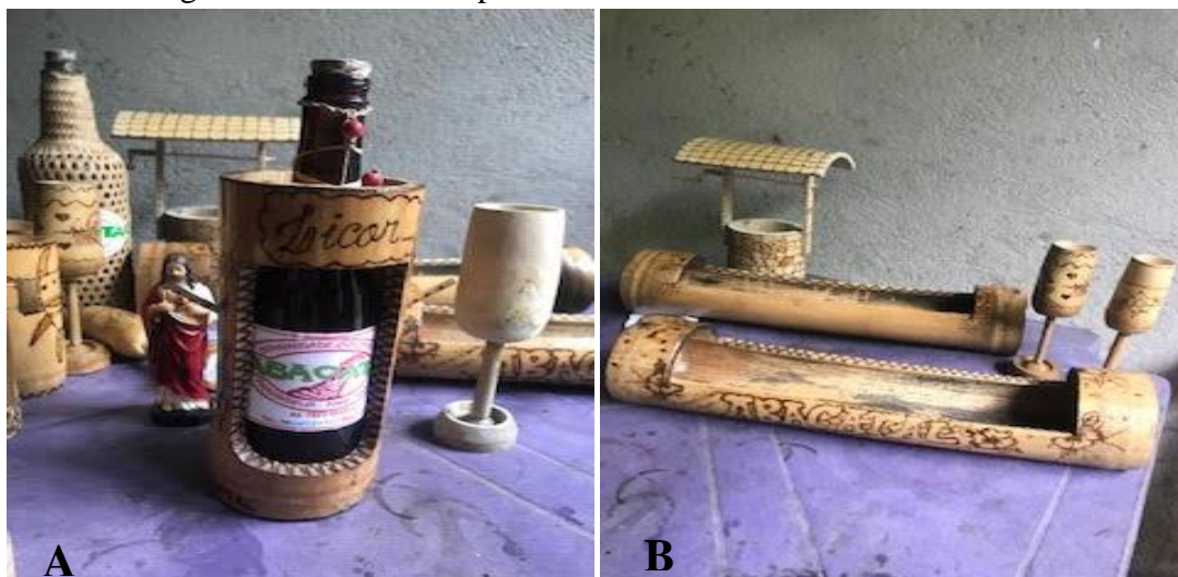
Figura 2 – Artesanatos produzidos na Comunidade de Abacatal

Na visita in loco 3 , verificou-se ainda algumas particularidades nas divisões sociais da comunidade que, além dos lotes para cada família, conta com espaço de lazer comum a todos, entre estes espaços estão um campo de futebol, um bar, uma área reservada para a sede da associação (figura 3), uma capela e uma escola de ensino fundamental. Destaca-se, ainda, como práticas socioculturais, a realização anual de três grandes festivais (festival do licor, do tucupi e do açaí), durante os quais a comunidade recebe populares de todo o entorno e das cidades vizinhas.