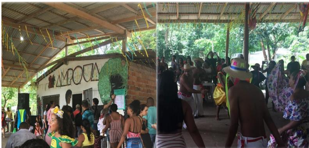
Figura 3 – Comunidade reunida em evento festivo (15/06/2019) na sede da Associação dos Moradores e Produtores de Abacatal e Aurá (AMPQUA)