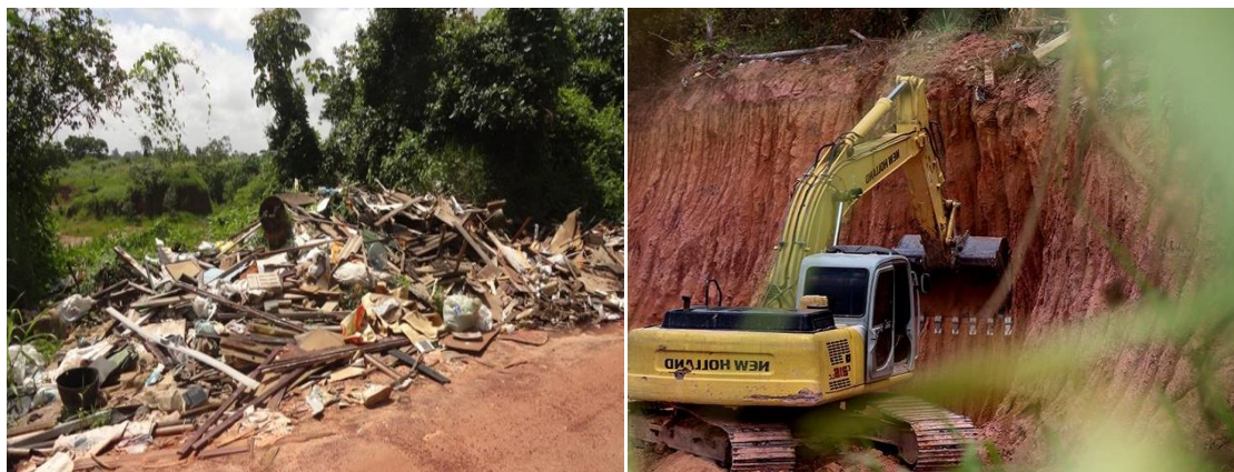
Figura 5 - Impacto do resíduo sólido e de atividade mineradora na estrada de acesso entre o Município de Ananindeua-PA e à Comunidade Remanescente Quilombola de Abacatal.