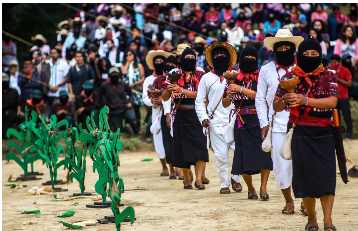
Danza del trabajo colectivo del maíz. Caracol II de Oventic, Chiapas, México.

en búsqueda de una expansión por medio de enlaces confederados. Nadie salva al pueblo. El pueblo se salva a sí mismo. Pero una parte nada desdeñable del pueblo puede estar atrapada en los engaños y manipulaciones del capitalismo. La sumisión voluntaria es el caldo de cultivo de la dominación. No obstante, se muestra que es posible romper esa sujeción. No se trata de que alguien venga de afuera a iluminar, sino de salir de la oscuridad por la propia experiencia y por procesos de difusión. Estos movimientos no se han limitado a domar democráticamente al capitalismo, sino que impulsan liberarse de sus domesticaciones y engaños, frente a la banalización de la democracia mercantilizada. Nocolás Maquiavelo indicó que todo Estado debía estar armado, pues cuando el pueblo no cree en el convencimiento, el poderoso tiene que someterlo por la fuerza. Vilfredo Pareto entendió la violencia como una recurrente