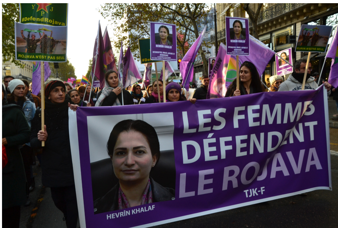
Las mujeres defienden Rojava, París, Francia.

La academia sigue sosteniendo que estamos en el Holoceno, pero desde la década de 1980 se planteó que nos encontramos en el Antropoceno, periodo que comienza con la agricultura y la ganadería, y es acrecentado por la sociedad industrial. La visión del Antropoceno plantea que el ser humano siempre ha estado en conflicto con la naturaleza, pero hay quienes consideran que este término mete a todos los seres humanos en el mismo saco, cuando existen grupos que sí han tomado en cuenta el respeto a la naturaleza. Jason Moore escribió un importante libro en 2016, en el que propone el término Capitaloceno. Plantea que la transformación en la biosfera no es únicamente resultado de un proceso geológico, sino histórico. Recomienda analizar las relaciones entre poder, naturaleza y acumulación capitalista. Moore destaca que el Antropoceno no