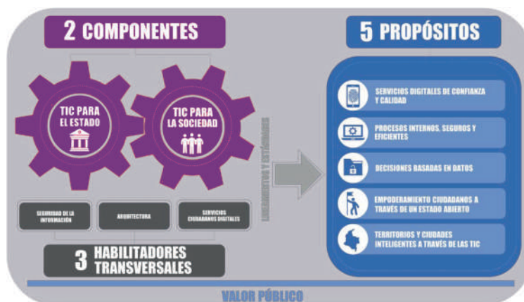
Figura 1. Elementos de la Política de Gobierno Digital

Lo anterior conduce a cinco propósitos: 1) Servicios digitales de confianza, 2) Procesos internos, seguros y eficientes, 3) Decisiones basadas en datos, 4) Empoderamiento ciudadano a través de un estado abierto, y 5) Territorios y ciudades inteligentes a través de las TIC [7]. A continuación en la Figura 1 se presentan los elementos mencionados.